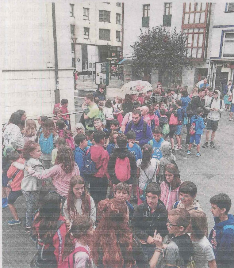
Numerosas actividades para la juventud ermuarra de Primaria. ■ A.L.

■ El Instituto Municipal de Deportes de Ermua, IMD, comunica que, con motivo de la asignación de la sala cardio del polideportivo Miguel Ángel Blanco como colegio electoral para las elecciones generales de este domingo, se suspenderá la clase de ciclo indoor de las 11 horas. Asimismo, las personas de los cursos de fitness y premium tampoco podrán hacer uso de esta sala durante la jornada electoral.