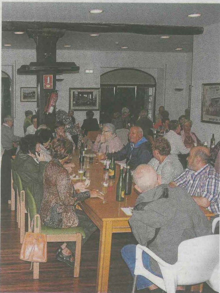
Arbil Jublatu Elkartearen bazkaria. :: SALEGI

Debako Arbil jublatu elkarteak ez du etenik hartzen atzo Kantabrian ibili ziren eta maiatzak 26rako bazkari bat antolatu du 80 urtetik gorako jubilatuentzat. 11:00etan meza eskainiko Debako elizan ondoren Gure Etxetxon salda eta txorizo egosia jateko aukera egongo da. 14:00etan jubilatuen elkarteaz bazkaltzera joan nahi dutenak gaur da azken eguna izena emateko jubilatuen elkarte bulegoan.