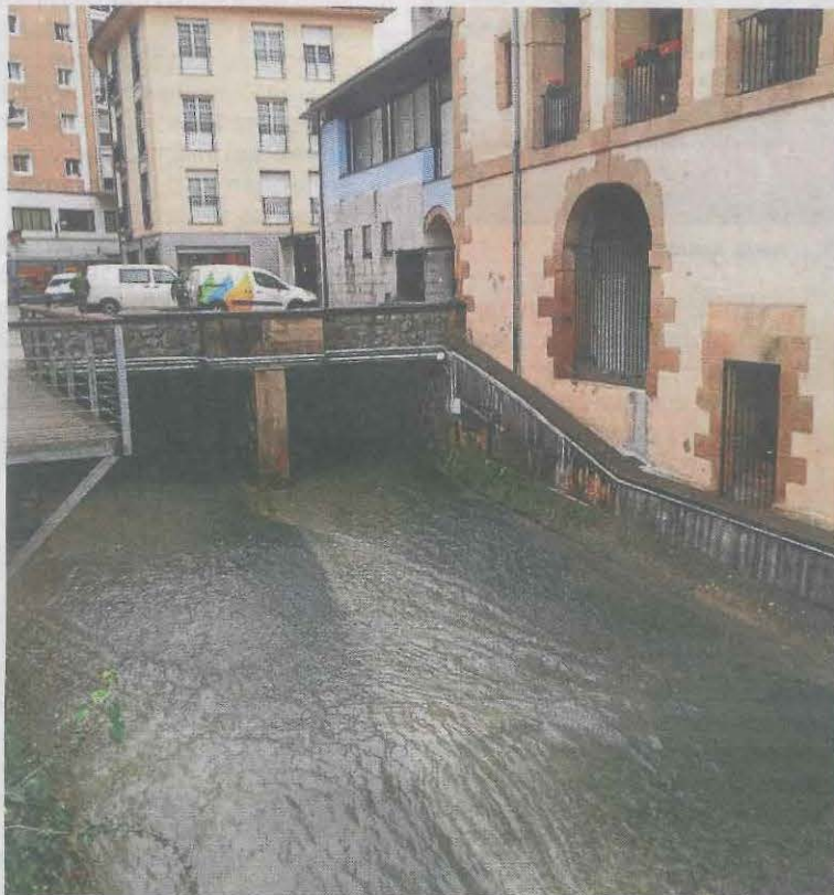
El río en Ermua, en la salida junto a la que se va a renovar.

ña en la plaza Cardenal Orbe. Comenzará a partir de las 19.00 horas. En este acto estará presente el candidato a la alcaldía de Ermua, Paul Yarza, que hablará sobre los objetivos del grupo para la próxima legislatura.