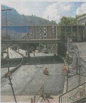
Operarios ultiman la señalización del parking.

Ermua vuelve a contar con el aparcamiento de San Antonio