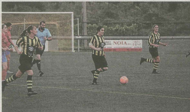
El regional femenino comienza la fase de ascenso.