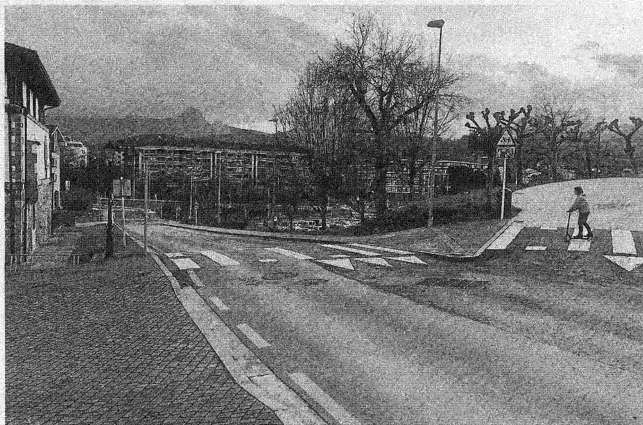
La intención del Ayuntamiento es adjudicar el proyecto este mes y ejecutarlo en febrero. Foto: K. Doyle

PARA FEBRERO El presupuesto económico del proyecto a ejecutar, que incluye pintura, señalización tanto horizontal como vertical y elementos de protección del carril, asciende a un total de 37.000 euros. En lo que a los plazos se refiere, desde la administración local "vamos a intentar adjudicarlo este mismo mes de enero y la intención es poder ejecutarlo en febrero", valoró Totorikaguena con esperanza de que se puedan cumplir los plazos previstos. — K. Doyle