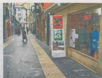
Local de Erdikokale. ■ A. L.

Este amigo reconoce que hay mucha de su obra que todavía no se ha recopilado. Entre estos «tesoros» se encuentra el juego de mesa «de los 4 idiotas», sobre los comportamientos de las personas, que el ermuarra ideó en sus últimos días y que probablemente sea uno de los objetos de una futura exposición.