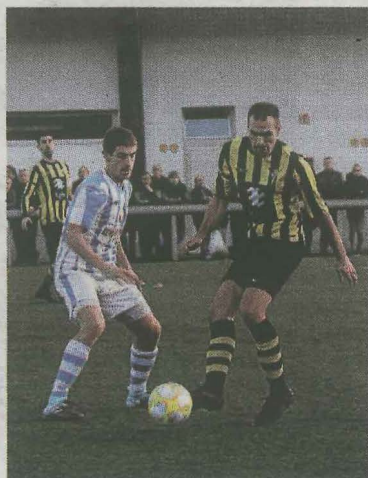
El regional masculino comienza la segunda vuelta.

El cadete femenino empató a uno contra el Goierri Gorri, con gol de Landa. Hoy se desplaza a Zumaia para enfrentarse a partir de las 12.15 al Zumaia. Las debarra son octavas en la clasificación con cinco puntos más que las de zumaia.