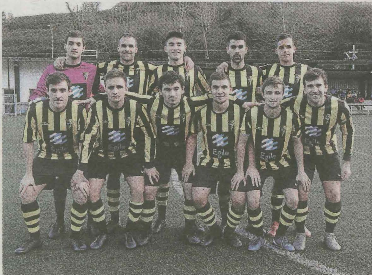
El equipo titular que salió ante el Mutriku.