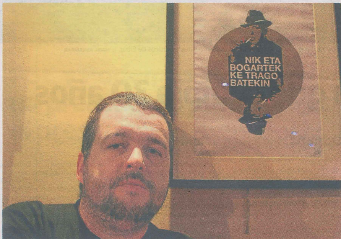
El malogrado artista ermuarra posa ante una de sus obras, un palíndromo en euskera.

La biblioteca municipal organiza para hoy en Lobiano la sesión de cuentacuentos 'Ipuin dibertigarriak' en euskera para niñas y niños de entre 6 y 8 años. Esta actividad, dinamizada por Sergio de Andrés, comenzará a las 17.30 horas.