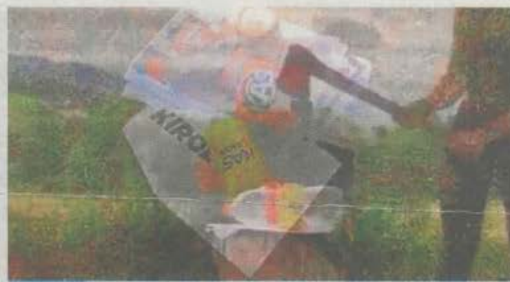
Imagen del video colgado en redes sociales por Ernai