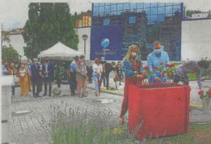
Al fondo a la derecha familiares de las víctimas durante el homenaje.