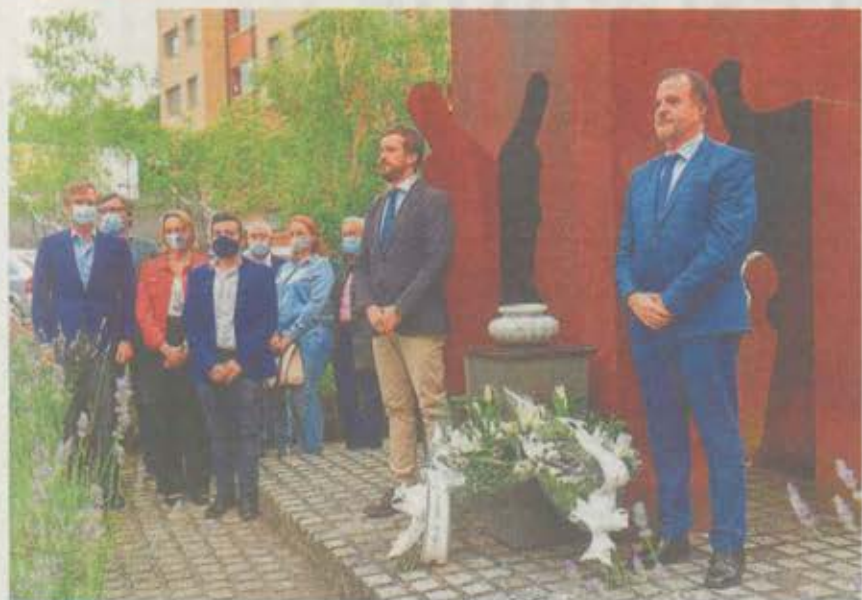
Pablo Casado y Carlos Iturriza, ayer durante el homenaje