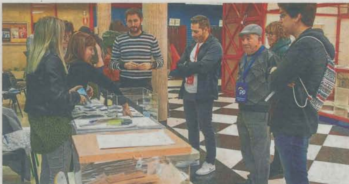
Las mesas de la plaza del mercado serán algunas de las afectadas por los cambios de ubicación.