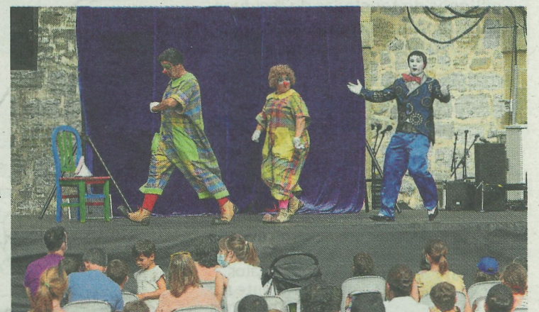
Txirri, Mirri eta Txiribiton actuando antes de la pandemia. LOBO ALTUNA

La cuota establecida para el bonito, al no estar repartida, es única para la flota española y las diferentes artes de pesca y asciende a las 17.700 toneladas, un nivel que experimentó un ligero aumento a consecuencia de la mejora del recurso.