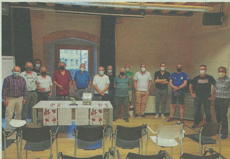
Miembros de la asociación posan durante la presentación. A. L.

Al igual que en anteriores ediciones las jornadas comenzarán con el Día del Deporte, que en esta edición se celebrará el día 21, con