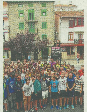
En una anterior edición. A. L.

Este año se contará con servicio de autobús. El precio de la iniciativa es de 170 euros.