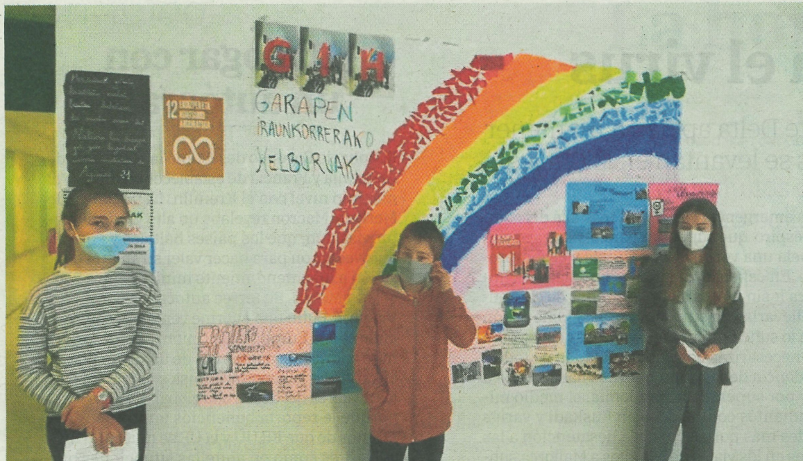
Luzaroko ikasleek bideo batez parte hartu zuten saioan. SALEGI