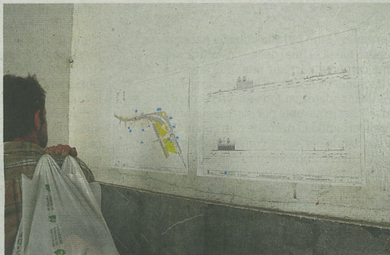
Punto de información sobre el proyecto. A. SALEGI

El proceso arrancó en 2021, fue presentado a la ciudadanía y comenzaron las reuniones con los agentes, la plantilla municipal y representantes políticos municipales. A lo largo del proceso se han llevado a cabo diversas iniciativas (mesas redondas, talleres, rutas...) y las aportaciones recibidas han sido muchas y de distinta naturaleza. El 30 de marzo se reunió por primera vez la Comisión Mixta de Urbanismo. Analizadas las aportaciones recibidas, se ha constatado la necesidad de actualizar el Plan General de Ordenación Urbana (PGOU) elaborado en 2007. Y con ese trabajo han empezado a trabajar.