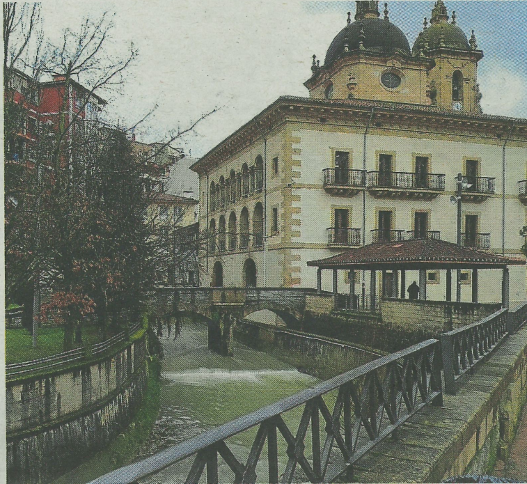
Con esta oferta pública de empleo se pretende aportar estabilidad. A. L.

En la presentación de esta oferta de empleo público se explicó que «en una semana se co-