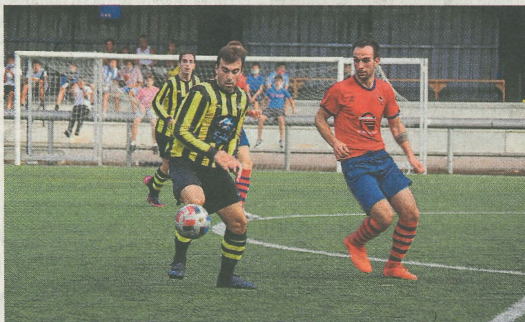
Aznal está plena racha.

su cuarto gol en tres partidos. Aún quedaban veinte minutos para el final del choque, y de ahí hasta el final el dominio del Amaika fue creciendo, terminando el partido acosando el área del Euskalduna en busca del gol de la victoria, que no llegó. Fueron varias las ocasiones de gol, pero las grandes paradas del portero visitante y el larguero en la última acción del encuentro evitaron que el Amaika consiguiera su tercera victoria consecutiva.