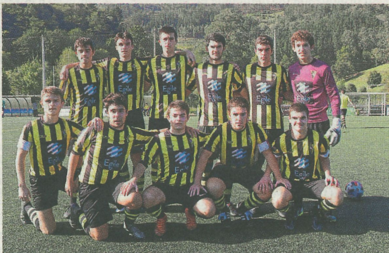
El juvenil volvió a reencontrarse con la victoria.

Tras el descanso, el Amaika no saltó bien al terreno de juego y durante el primer cuarto de hora dejó de tener el control del juego. Fruto de ello, el Euskalduna gozó de una buena ocasión que no supo definir, y poco después, en una acción similar a la anterior, esta vez sí, anotó el segundo gol adelantándose en el marcador. El partido se le puso cuesta arriba al Amaika hasta que un buen centro lateral de Danel fue cabeceado al fondo de la red por Markel Aznal estableciendo el empate a dos. Con este gol, el delantero debarra consigue anotar