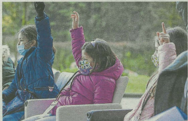
Los escolares ayudaron a instalar las señales.