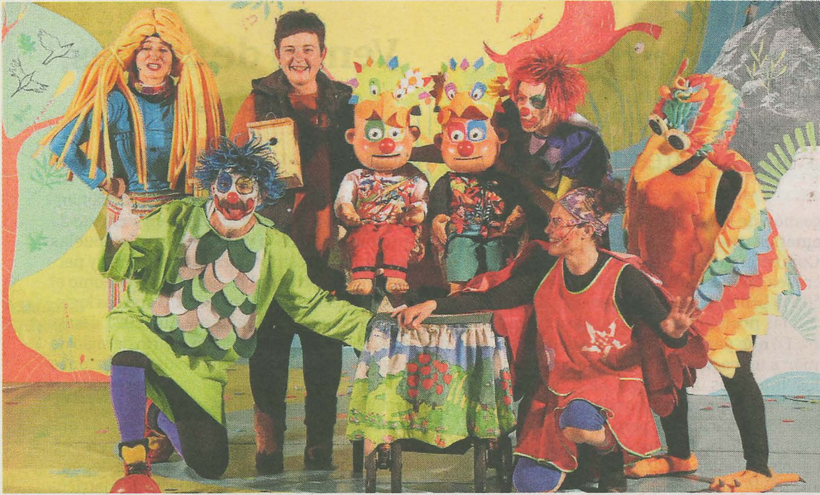
La alcaldesa de Itziar posó junto a los payasos.