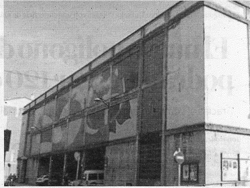
La plaza del mercado será rehabilitada.

En lo que al proyecto se refiere, tiene como objetivo conservar y revitalizar esta infraestructura municipal, transformando el antiguo edificio de la plaza del mercado en un nuevo polo de dinamización social, cultural y comunitaria. En este sentido, la actuación busca recuperar el entorno urbano y reforzar su papel