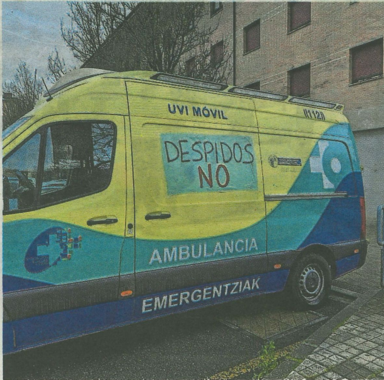
Actualmente las ambulancias sirven de soporte a su reivindicación. E. C.

Según explican los profesionales afectados, que cuentan con una experiencia de entre 20 y 27 años en sus puestos, «nosotros estábamos medianamente tranquilos porque en nuestro convenio de ambulancias existe un apartado expreso en el que pone que ya sea un ente público o una empresa privada quien continúe con la actividad tiene que contratar a los empleados. Estábamos más o menos tranquilos hasta que la semana pasada nos han reunido en la empresa y nos han