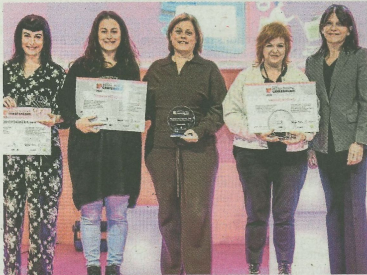
Las finalistas ermuarras de Trucco's y Akerlei posan en el acto.

Los premios de la sexta edición de este concurso de escaparatismo se entregaron la semana pasada en el Palacio Euskalduna, acto en el que los comercios ermuarras recibieron un diploma en calidad de finalistas.