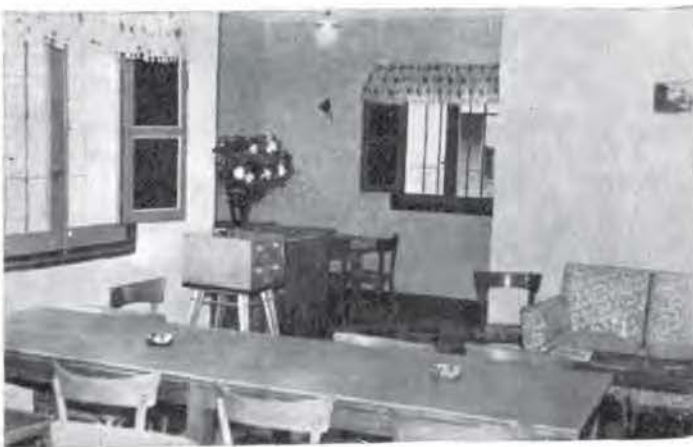
Otro aspecto de esta Biblioteca