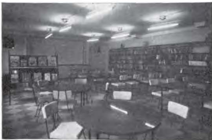
Un aspecto de la espaciosa y bella Biblioteca de Ermua