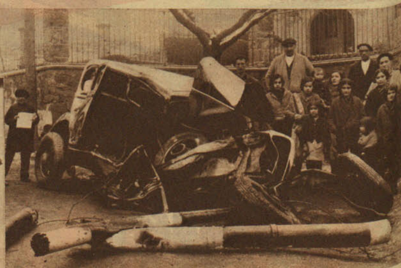
El automóvil que chocó con el tren en el paso a nivel de Ermúa después de romper la barrera