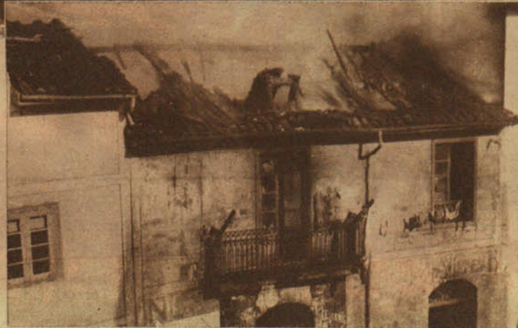
En Santander, el fuego dejó completamente destruida una fábrica de jabón instalada en el barrio de Campogiro