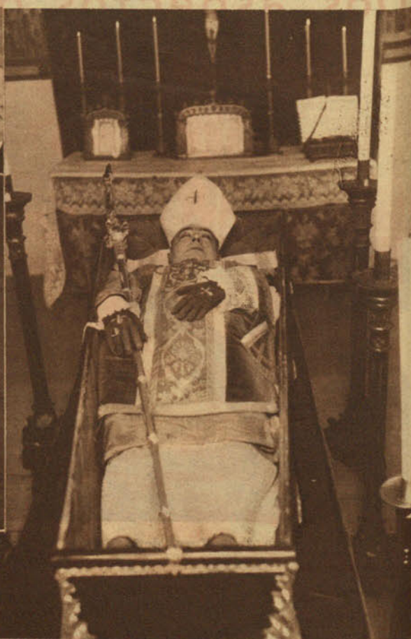
El cadáver del obispo de Salamanca, don Frutos Vallent, expuesto en la capilla ardiente, por la que desfilaron en gran número sus diocesanos