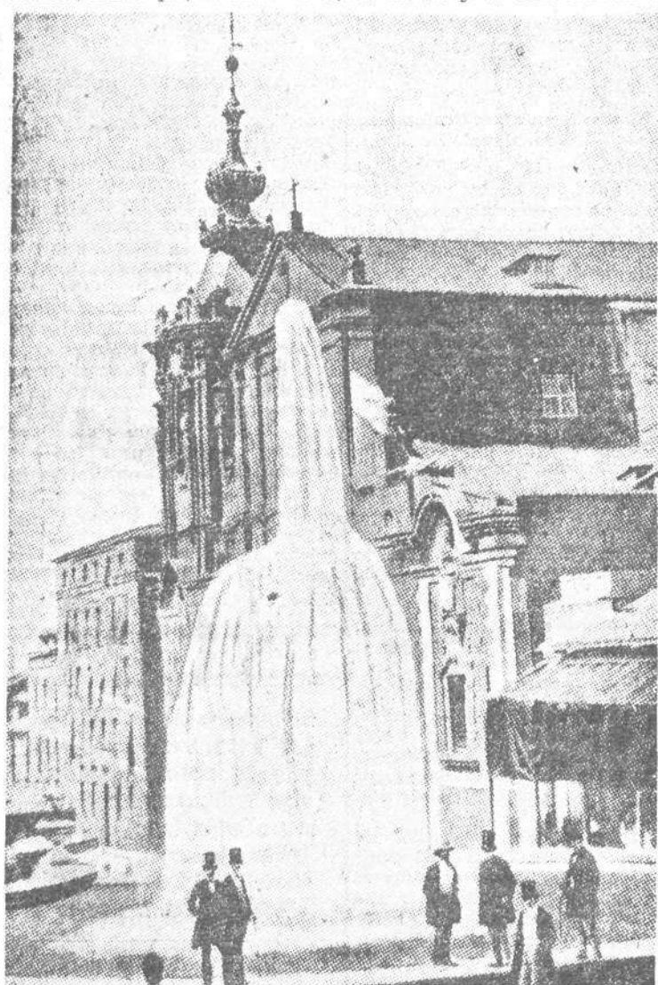
Fuente monumental instalada en lo alto de la calle Ancha de San Bernardo y que anunció a los madrileños el 24 de junio de 1858 la inauguración del servicio de abastecimiento de agua

De venta, 5,80 pesetas (timbre incluido), en todas las farmacias, y en MADRID: GAYOSO, Arenal, 2; FARMACIA DEL GLOBO, plaza Antón Martín; FELIX BORRELL, Puerta del Sol, 5.