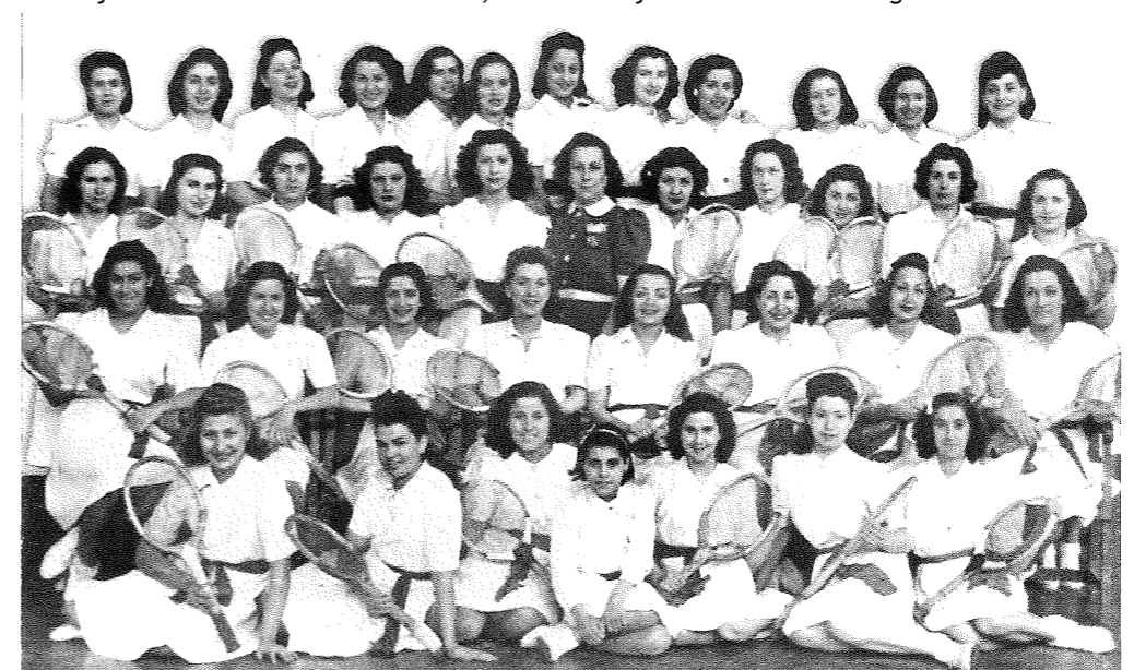
Etxelik urrin, bizimodua etara eñ bihar.