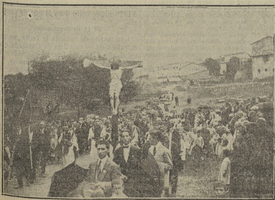
Llegada de los peregrinos a San Pedro de Rocelló con el nuevo Santo Cristo de la Asociación de la Pasión y Muerte de nuestro Señor Jesucristo.