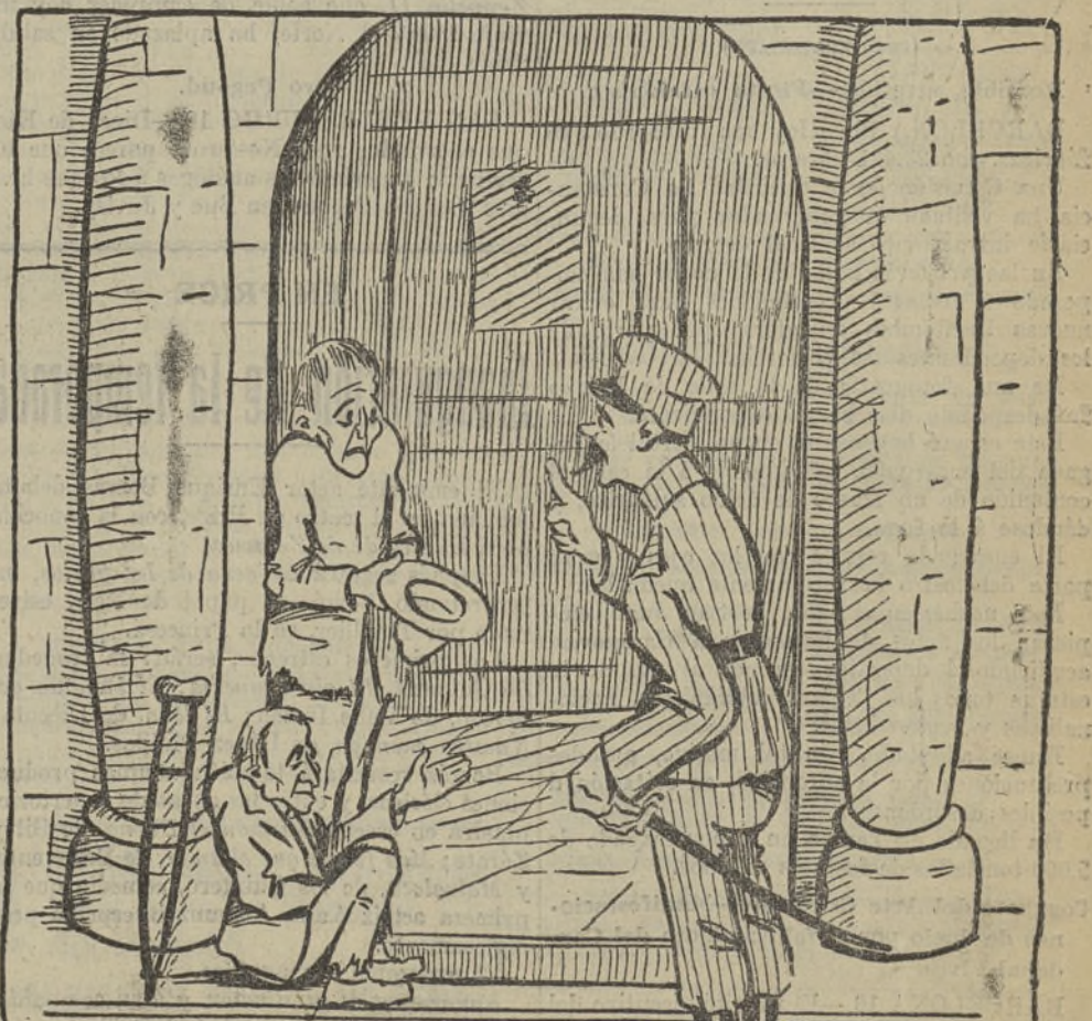
EL GUARDIA.—Marchen de aquí inmediatamente; para pedir en las iglesias es necesario estar con sombrero de copa y levita y hablar francés.