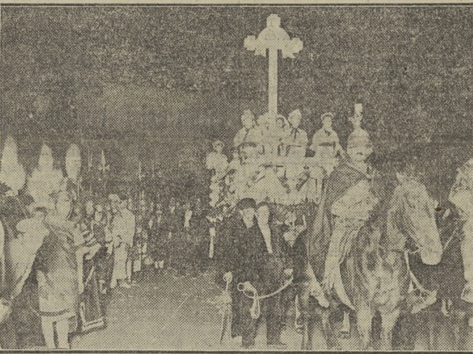
Cabalgata histórica de la publicación del edicto de Milan, en la que tomaron parte 150 personas y la carroza que representaba la aparición de la Cruz al Emperador Constantino.

Comandante general desde Alcázar me ordena comunicar á V. E. haber llegado esta tarde á dicha plaza sin novedad la columna que, procedente de Arcila y Kudia Fraicartz,