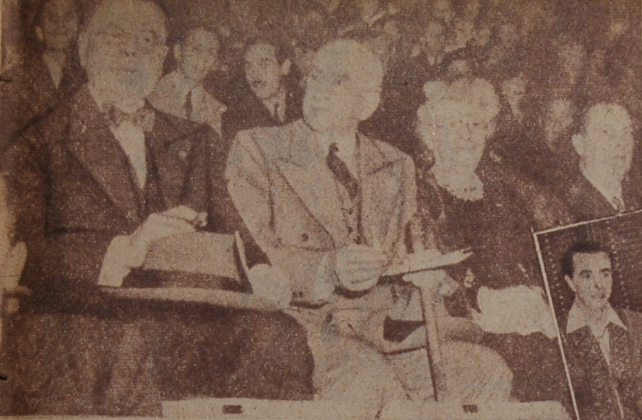
Con toda pompa, se celebró un festival en el Frontón al que acudió todo el cuerpo diplomático residente en México. Entre la distinguida y numerosa concurrencia se encontraba Mr. Messersmith, embajador de los Estados Unidos en México. Aquella función fué en honor de los cancilleres que acudieron a la Conferencia de Chapultepec.