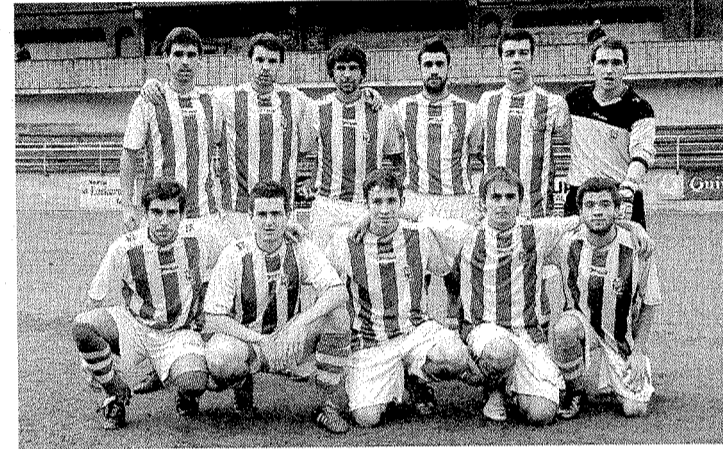
El Mutriku Regional va adaptándose a la fase de ascenso. ** GORRITIBEREA

El Burumendi infantil descansará en la presente jornada y el equi-