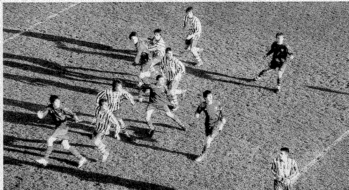
Fútbol. El Burumendi disputó un bonito encuentro frente al Eibar. GORRITIBEREA

El segundo equipo del Mutriku Fútbol Taldea, el Burumendi está realizando un final de temporada ciertamente interesante, como muestra el partido disputado en la última jornada, donde los mutrikuarros vencieron al líder Union Txiki a domicilio por 2-3.