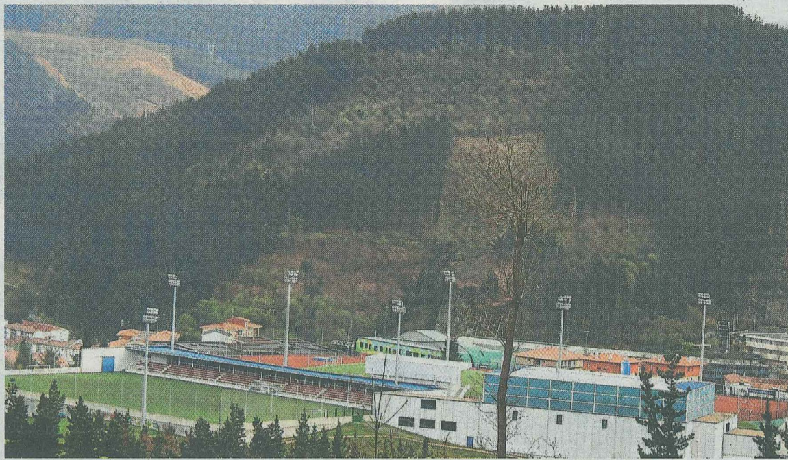
El plan estratégico local del deporte no se limita al ámbito de las instalaciones deportivas locales. A. LASUEN

Con el Plan Estratégico del Deporte se trata de desarrollar e impulsar una estrategia municipal de deportes y, para ello, se intentan marcar unas líneas de actuación para los próximos años.