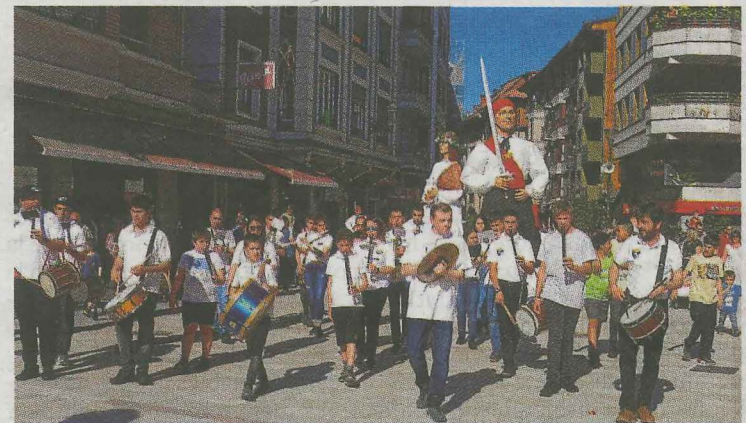
Las bandas de txistu y de música, junto a los gigantes.

Explosión festiva que fue acompañada por las melodías de la 'Marcha de la SD Beasain', repetida numerosas veces por las Bandas de Musika Eskola y los txistularis de Goiz Eresi. Se dio inicio a la kalejira con los gigantes y cabezudos de la comparsa local Ekaitz, acto al que este año se sumaron los de Mendilorri de Iruña. La bajada por la cuesta de la plaza, acompañada de las carreras de los cabezudos, suele ser uno de los momentos más esperados por los pequeños, el inicio de sus intensas y aceleradas carreras delante de los 'buruhandiak'. La kalejira dio paso a la popular txistorrada, en la plaza Zubimuzu, que es gestionada por numerosos miembros de Atzegi, mientras que en Aranealde se inauguraba la muestra de sus talleres de manuales. Al anochecer no hizo falta mirar al firmamento para saber si la meteorología respetaría la bajada de Mari y los conciertos de Bide-luze y de las txosnas. La fiesta no ha hecho más que empezar. Quedan nueve jornadas festivas por delante con más de un centenar de propuestas para todas las edades.