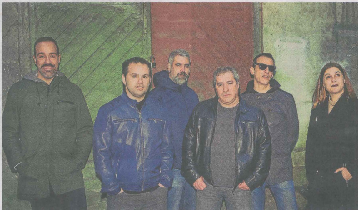
Miembros del grupo Versionarios, que actúan esta noche en la plaza 8 de mayo.

-Todo tiene su cosa. En un bar es más cercano, un fin de semana, la gente está más desinhibida. En un concierto no tienes tan claro si a la gente le gusta lo que tocas. Según