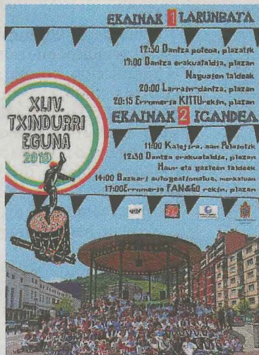
Cartel del 'Txindurri Eguna'.

pular larraindantza, también en la plaza. De 20.15 en adelante tendremos romería el grupo Kittu. Continuará el domingo a partir de las 11.00 con una animada kalejira que partirá desde la plaza San Pelayo para después, a las 12.30, ofrecer una demostración de baile en Cardenal Orbe. En esta ocasión, será el turno de los grupos de niños/as y jóvenes. Todas las personas participantes se reunirán a las 14.00 para la comida popular autogestionada. El fin de fiesta con el grupo FUN&GO y su música de romería, que comenzará a las 17.00.