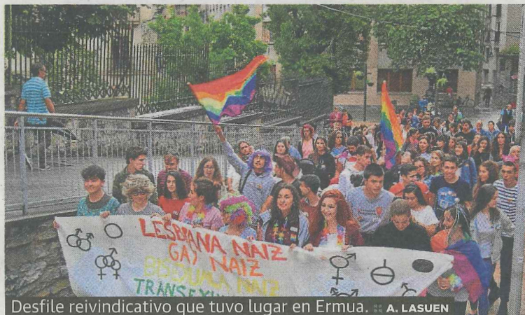
Desfile reivindicativo que tuvo lugar en Ermua.

file reivindicativo que realizaron por el municipio, con paradas en puntos concretos para destacar figuras mundiales representativas del colectivo LGTB. Luego, se celebró una concentración en la plaza. Por la noche, se presentó el nuevo colectivo joven ermuaarra y se proyectó una película en Eskilarapeko. La juventud que compone este grupo quiso agradecer al colectivo feminista joven de Ermua, Nushu, su colaboración en la organización de estas actividades.