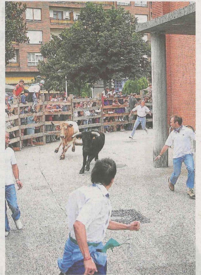
Este año sí habrá encierros en fiestas.