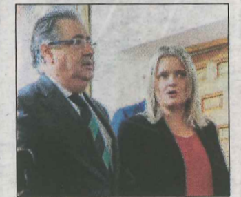
El ministro Ignacio Zoido. J.S.G.

Zoido se mostró partidario de que las víctimas puedan «contar su experiencia (...) a los jóvenes y a los niños, para que se sepa lo que pasó y el sufrimiento que tuvieron que