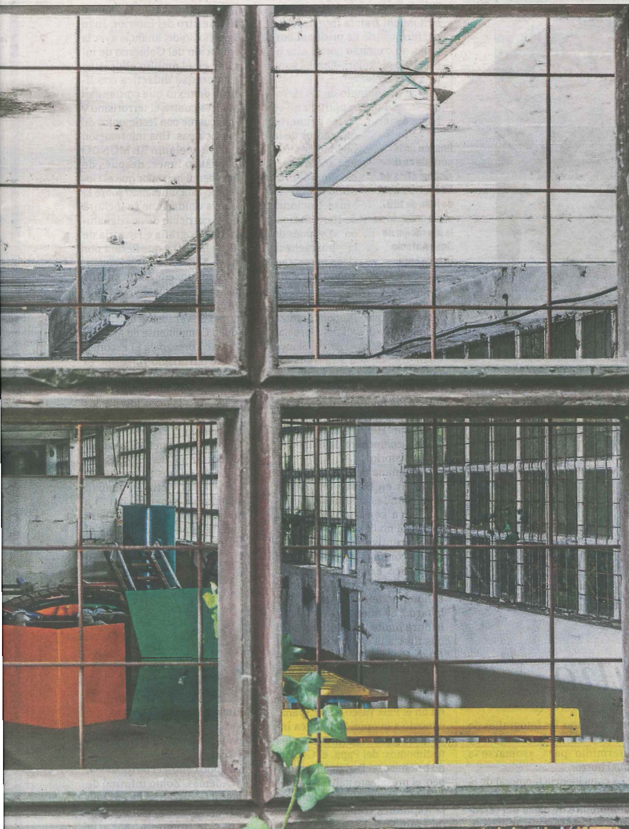
El acceso al zulo, ahora hormigonado, estaba junto al objeto verde y al naranja.

crueldad. Apenas 10 días después, secuestró al concejal del Partido Popular en Ermua Miguel Ángel Blanco. Su asesinato a cámara lenta dos días más tarde supuso una segunda derrota de los terroristas. Este crimen dio origen al nacimiento de lo que se conoce como 'Espíritu de Ermua' y que visualizó la pérdida del control de la calle por parte de los que aplaudían a ETA, el final del silencio de los que estaban contra el terrorismo en el País Vasco y en Navarra.