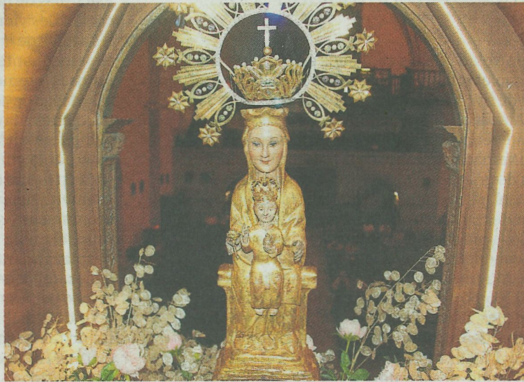
La virgen, con la corona que se le pone el primer domingo de agosto. I.A.

Los marineros al comienzo de la campaña de la caza de la ballena, celebraban una gran fiesta en Itziar, el 23 de octubre, fes-