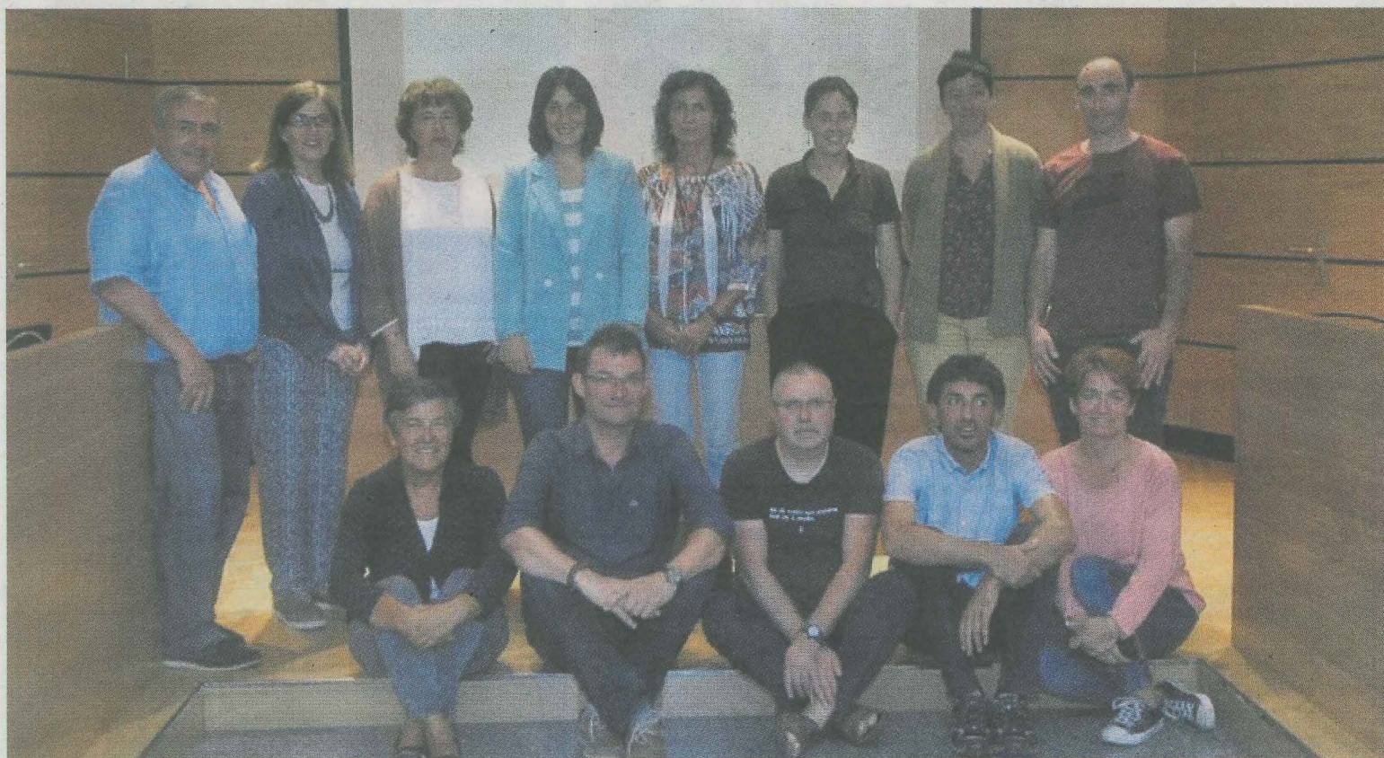
Representantes de los Ayuntamientos de Debabarrena que han trabajado en un nuevo plan de difusión del euskera.

La Unidad de Diversidad Cultural del Departamento de Servicios Sociales del Ayuntamiento de Eibar ha organizado esta charla con estas dos cooperantes eibarresas que trabajan en Grecia. La entrada es libre.