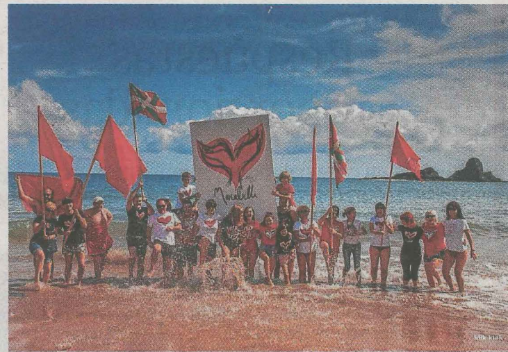
Presentación del festival Marabilli en la playa de Arrigorri.