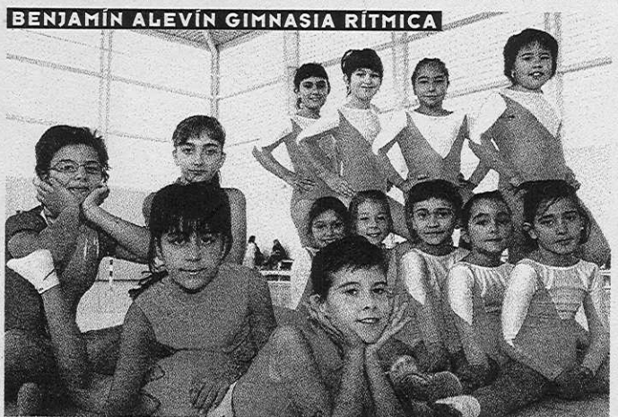
BENJAMÍN ALEVÍN GIMNASIA RÍTMICA