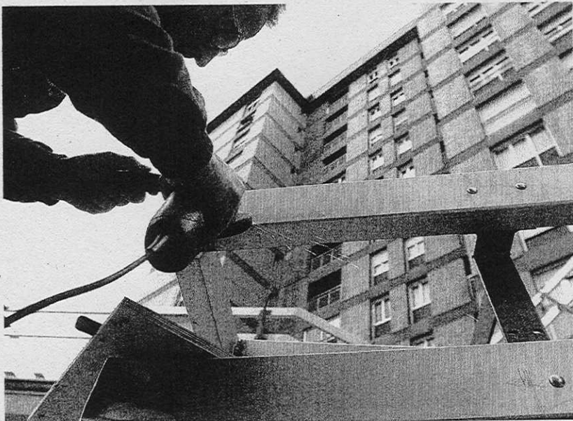
QUEJAS. Aspecto que presentan las obras de reurbanización.