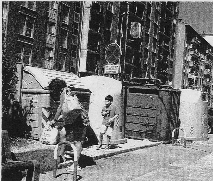
SUBIDA NOTORIA. Una mujer se dirige a arrojar la basura a un contenedor en Ermua.

Todos los grupos políticos se mostraron a favor de este último punto, incluido el PP, que votó, en cambio, en contra de la pro-