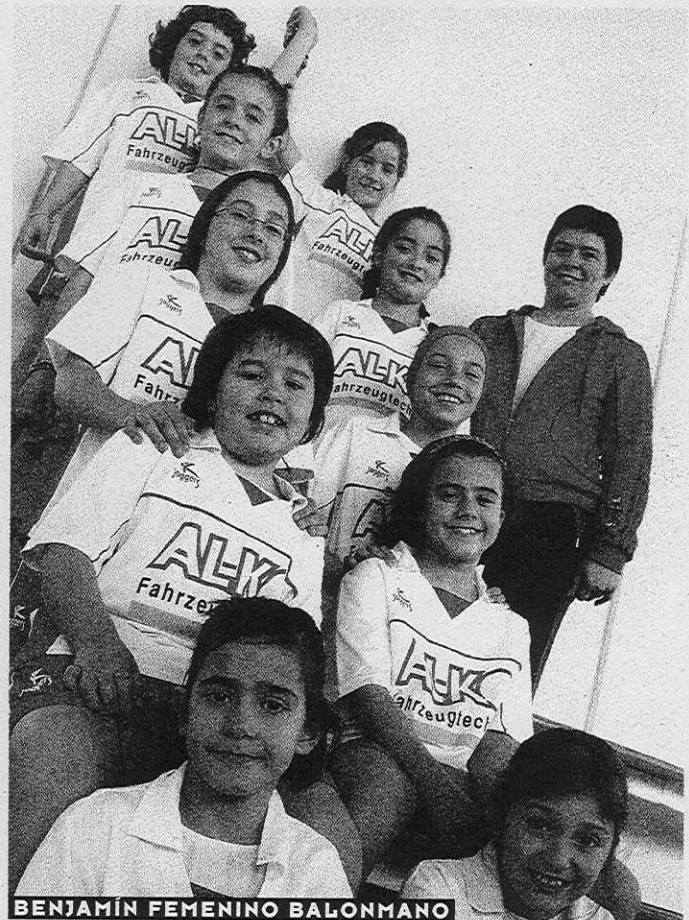
BENJAMÍN FEMENINO BALONMANO