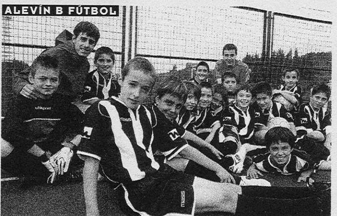
ALEVÍN B FÚTBOL