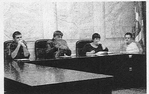
Sesión plenaria celebrada en el Ayuntamiento días atrás.

En el impuesto sobre obras, también se aplicará la subida del IPC. Sin embargo, en las obras que afecten a la comunidad, tales como fachadas o tejados, habrá bonificaciones del 95%. Estas serán del 90% en caso de instalar un ascensor. ■