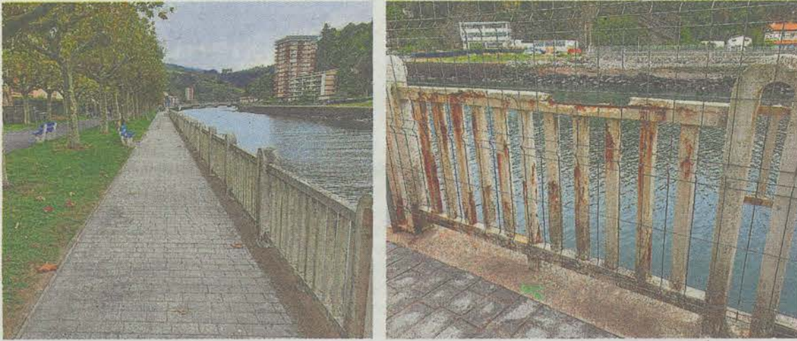
La barandilla de Arrantzale kalea, que está dañada en varios puntos, sera sustituida.