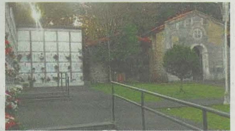
Cementerio Garagartza. A.Z.

Por este motivo los dos cementerios de la localidad llevan días abiertos y se mantendrán así al menos hasta mañana.