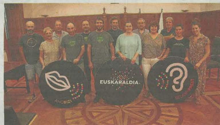
Udalak euskaraldian parte hartuko du. A. SALEGI

Debako Udalbatzak bat egiten du, 2022ko azaroaren 18tik abenduaren 2ra, Euskal Herri osoan zehar bideratuko den Euskaraldiarekin, eta ekimenaren sustatzaile izango da Debako Euskaraldia taldearekin batera. Horren-