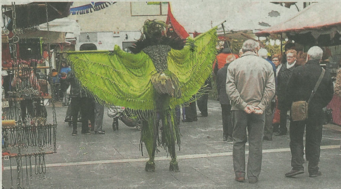
La feria medieval convivirá con el programa organizado por la Comisión de Fiestas del barrio. A. L.

Ese mismo viernes, de 17.00 a 21.00 horas, los más pequeños de la casa se divertirán a lo grande con el parque infantil. Los 'bufones de la corte' darán la bienvenida al público que se acerque