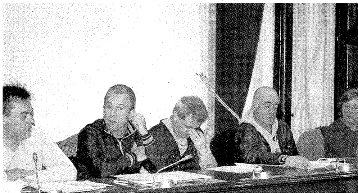
Concejales de Bildu, que plantearon la moción para que Eusko Tren revise sus tarifas.

Según los datos aportados por Bildu, «en tarifas habituales hubo un ascen-