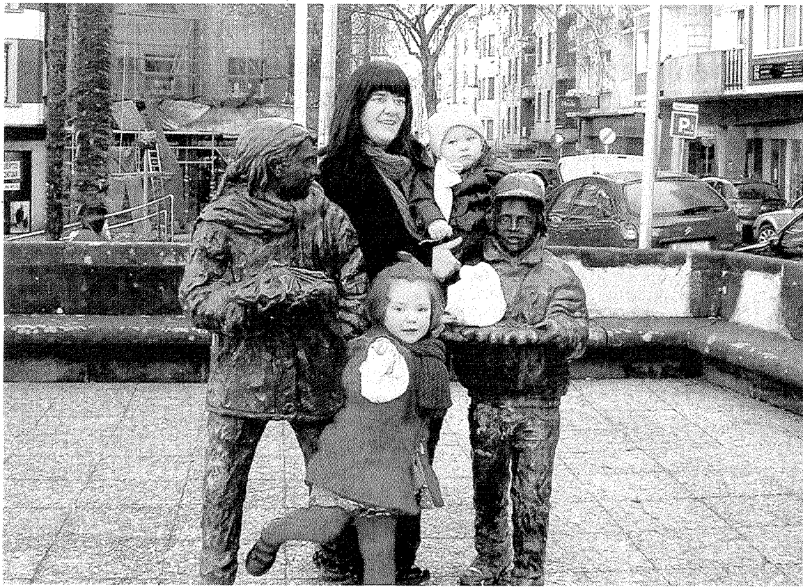
La foto junto a la estatua de los 'sanblasitas', en San Andrés, es también una tradición.

Pero no hay que olvidar a todas aquellas amas de casa que siguen elaborando sus tortas de San Blas en sus propias cocinas, y que han logrado transmitir esta tradición a la siguiente generación. En la propia panadería Isasi confirman que buena parte de la clientela compra por estas fechas los ingredientes necesarios para elaborar las tortas. «También vendemos los ingredientes por separado, porque sabemos que muchas de nuestras clientas elaboran el 'sanblás' en casa, y vienen a la tienda a