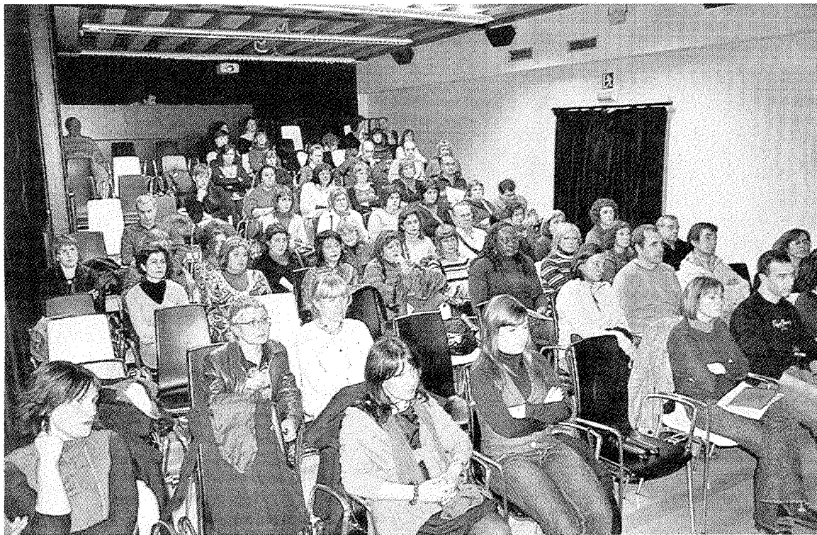
Asistentes a la sesión de clausura de este servicio en el curso anterior. ■ A. L.

Los encuentros se producirán en diferentes días y horas y se tratarán diversos temas dependiendo de la edad de los escolares. Hay que tener en cuenta que el hecho