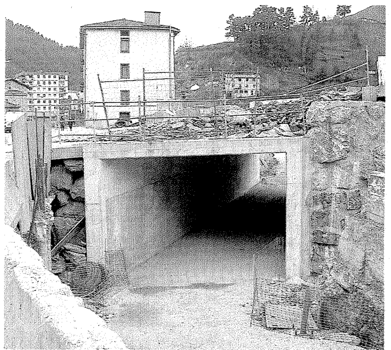
Vista del paso subterráneo peatonal entre Eibar y Ermua.

La concejala de EB ha criticado que el diputado de Infraestructuras Viarias, Eneko Goia, «no ha tenido para nada en cuenta la perspectiva transversal de género en el análisis y propuesta de nuevos espacios urbanos y arquitectónicos» «A la Diputación de Guipúzcoa y a Eneko Goia no le han importado en absoluto estas recomendaciones, ni tampoco las reivindicaciones de la ciudadanía de Eibar y de Ermua, que no quiere un paso subterráneo y así lo ha demandado en numerosas ocasiones», ha concluido Gómez.