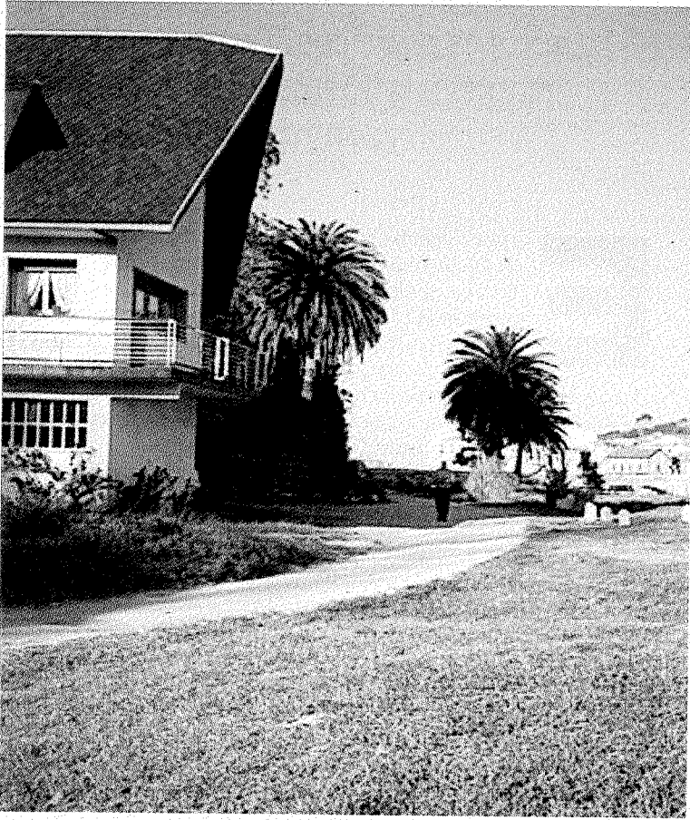
Casacampon burutuko dira landaketa eta hondakinen garbiketa.

Casacampon egingo bigarren ekintza. Debanaturak animatzen ditu biztanle guztiak hezegunera