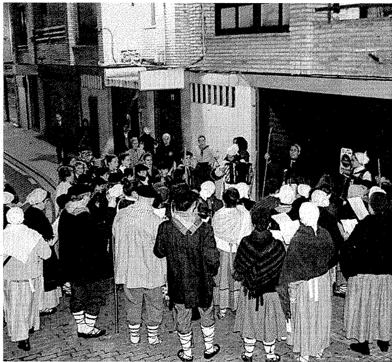
El Coro Aitzuri cumplirá el martes con la tradición de Santa Águeda.

martes, a partir de las 18.30 horas. Será el momento del punto de encuentro, que tendrá lugar en el aula del coro, situada en la Escuela de Música.