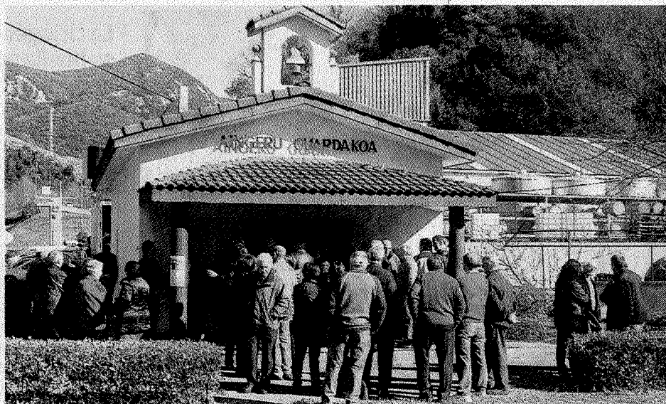
Una mujer reza ante el Santo Ángel de la Guarda. Muchas personas no pudieron entrar en la ermita para seguir la misa.