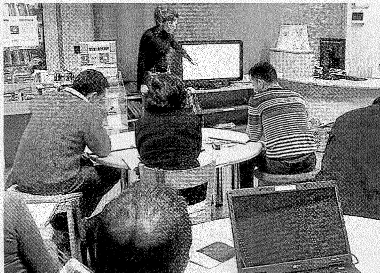
La biblioteca volverá a tener este aspecto el jueves.

El Ayuntamiento de Ermua promueve sesiones de recursos laborales con desempleados