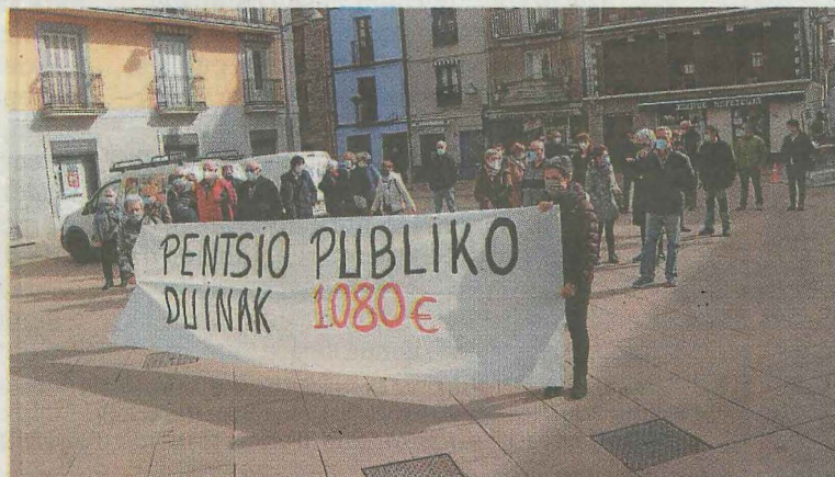
Concentración de pensionistas en la localidad. A.S.

DEBA. Deba contaba en 2018 con alrededor de 5.000 habitantes, de las que el 22% (1.202 personas) eran mayores de 65 años. Desde el mes de enero cada dos semanas un grupo de pensionistas de Deba e Itziar se reúnen en la plaza del Ayuntamiento para reclamar unas pensiones dignas. Ayer volvieron a repetir con una concentración en la que se respetaron las medidas de seguridad establecidas por el gobierno vasco en la lucha contra el coronavirus.