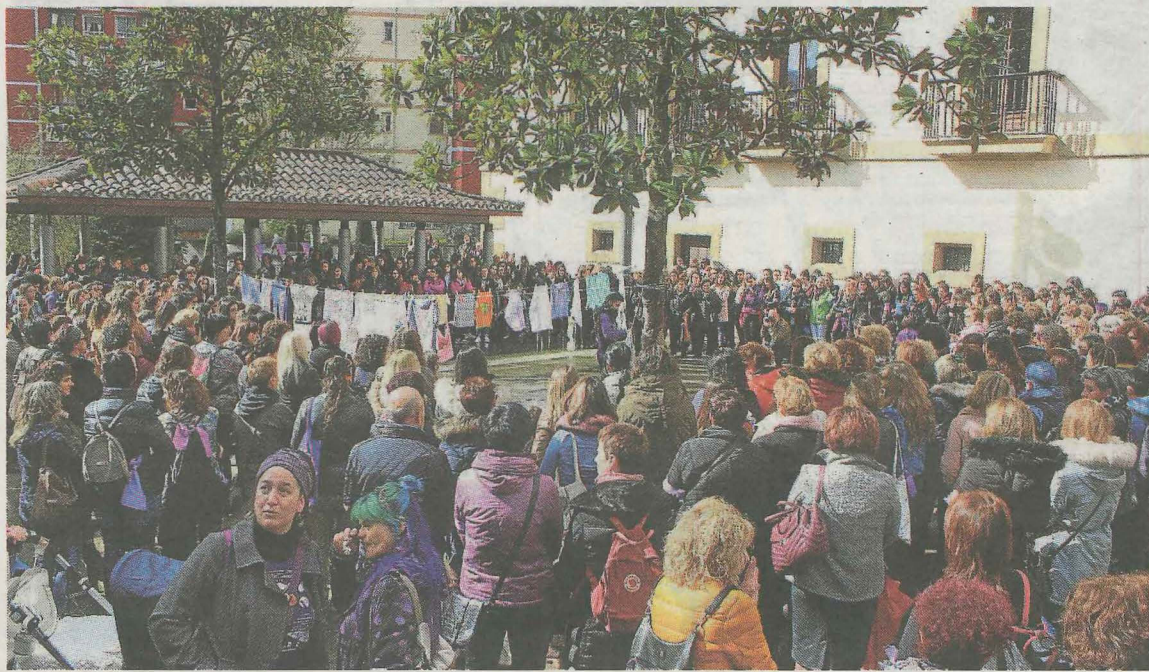
La plaza 8 de Marzo pretende recordar y visibilizar que «todos los días son 8M» en Ermua (foto archivo). A.L.

El teatro del viernes también se enmarca dentro de esta programación. En concreto, a partir de las 19.00 horas, se represen-