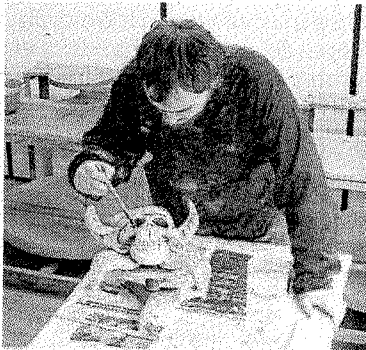
Trabajos en el centro.

la exposición llevada a cabo por los alumnos de pintura adultos e infantiles de Hantz Haundi para dar cobijo a partir del lunes a las obras de los estudiantes del Centro de Enseñanzas Artesanales. La exposición permanecerá allí hasta el 17 de junio.