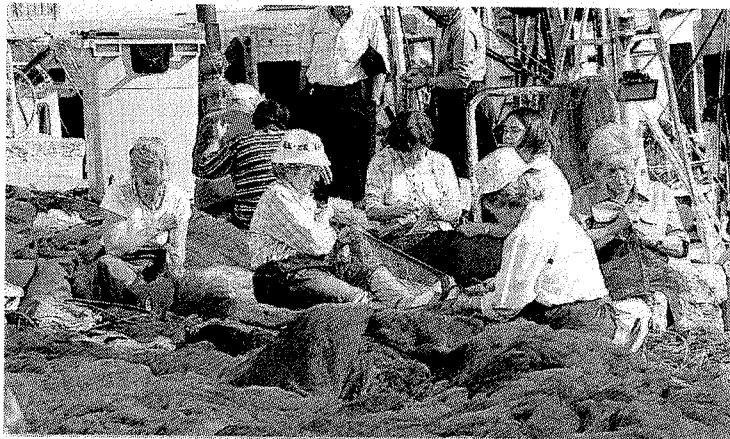
Mujeres. La tarea de las rederas se nota en la vida de Ondarroa.

Hoy, sábado, se celebra la decimotava edición del triatlón de Ondarroa, siendo el séptimo memorial Gerardo Saiz, alma mater del triatlón ondarrutarra. La prueba estará organizada por el Ondarruko Koaxi Triatloi Taldea y la Euskadiko Triatloi Federazioa, siendo prueba puntuable para el circuito vasco-navarro 2012. La salida femenina será a las 15.30 horas y a las 15.45 horas en categoría masculina. Los boxes estarán situados en la plaza Itxas Aurre.