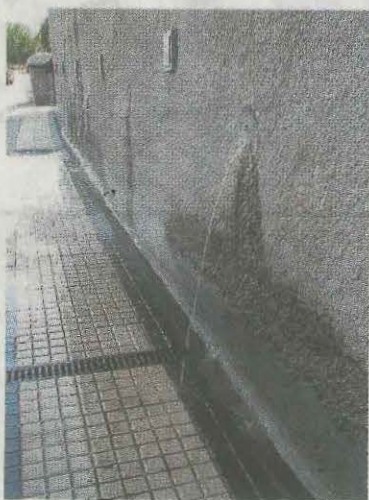
Chorro de aguas fecales.

Ayer lunes, acudieron los técnicos municipales junto con los técnicos del Consorcio de Aguas de Gipuzkoa y los responsables municipales, y tras realizar diferentes comprobaciones desde los tubos de desagüe y desde las arquetas superiores, vieron que uno de los micropilotes del muro afectó