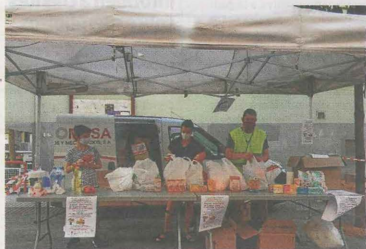
Una familia voluntaria del AMPA durante la recogida. A. L.

La organización del AMPA de San Pelayo agradece a todos los colaboradores y población ermuearra su solidaridad.