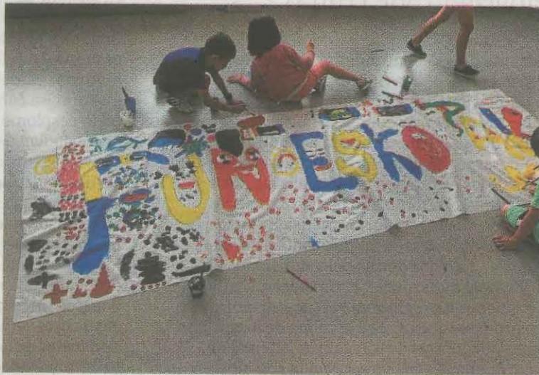
Las colonias serán quincenales, dependiendo de la edad. ANDER SALEGI

Los grupos y fechas serán los siguientes: del 8 al 19 de junio los nacidos en 2012; Ddl 22 de junio al 3 de julio nacidos el 2011; del 6 al 17 de julio nacidos en 2014 y 2013, y la última tanda estará reservada del 20 al 31 de julio para los nacidos en 2010 y 2009.