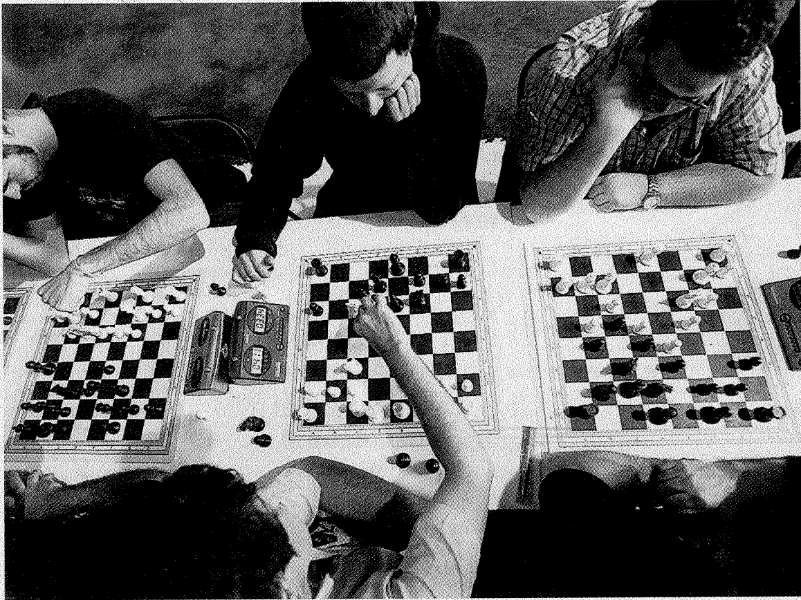
Imagen de la última edición del Torneo Villa de Deba de ajedrez.