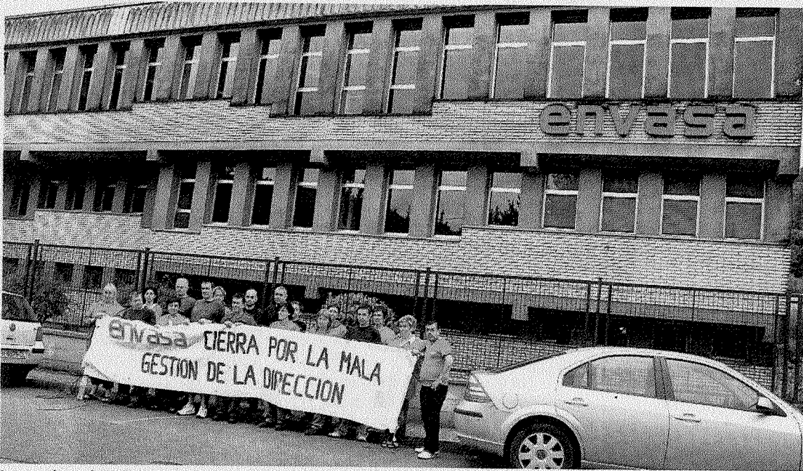
Los trabajadores, en una de las concentraciones frente a la sede de la empresa. ■ A. L.

En esta muestra llena de simbolismo y vida también se pueden ver maquetas de obras suyas que en la actualidad se ubican en el camino de la playa de Zarautz o en Benidorm, donde alcanzan muchos metros de altura.