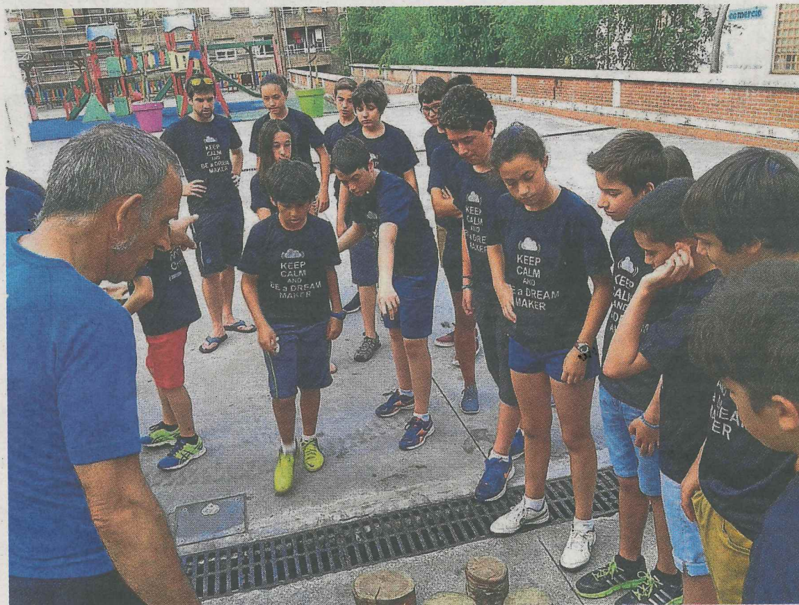
Un grupo de jóvenes participantes en el campus tecnológico del pasado mes de julio.

Reale (cuchillería) les planteó el reto de desarrollar un modelo de navaja multiusos, incluyendo un metro y un nivel en su diseño.