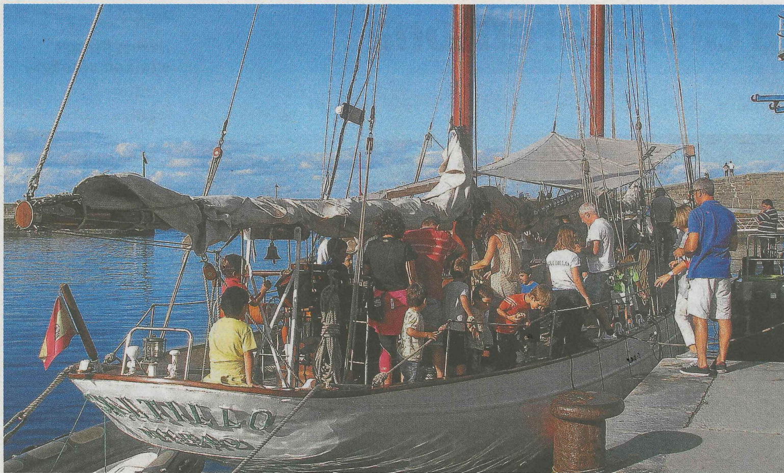
Fueron muchos los mutrikurras que se aproximaron a visitar 'El Saltillo' a última hora de la tarde.