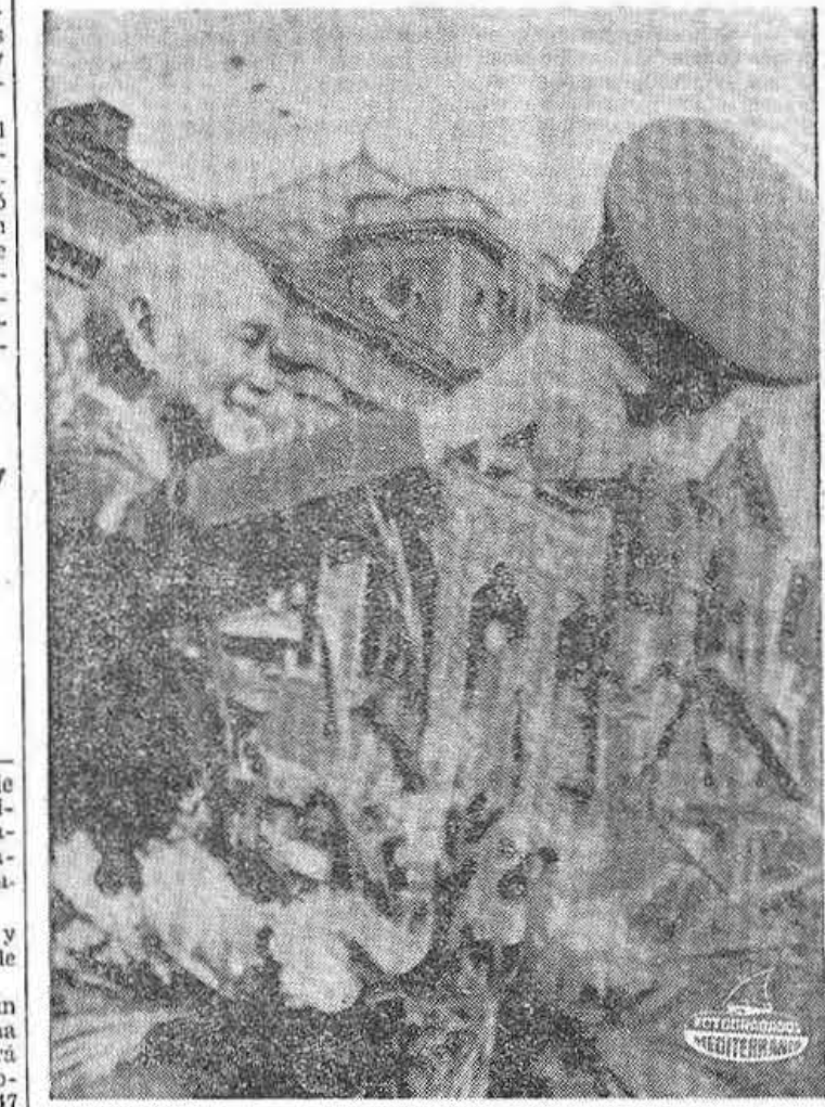
TAIPEI. — El Presidente Chiang Kai-shek de la República Nacionalista China, saluda desde el balcón de la mansión presidencial a cerca de un cuarto de millón de personas congregadas en la plaza con motivo del LVIII aniversario de la fundación de la República — el 10/10 (Doble Diez).