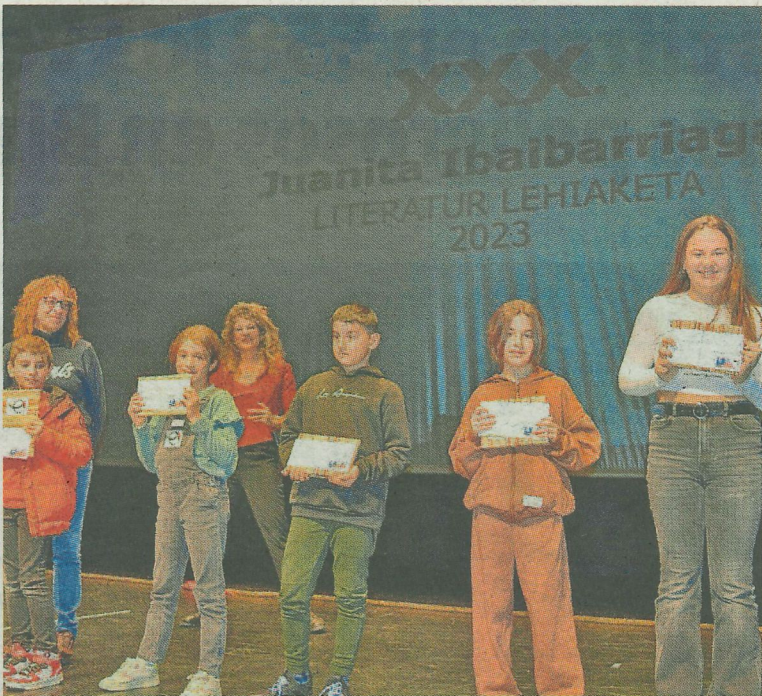
Imagen de una anterior edición del certamen Juanita Ibaibarriaga.