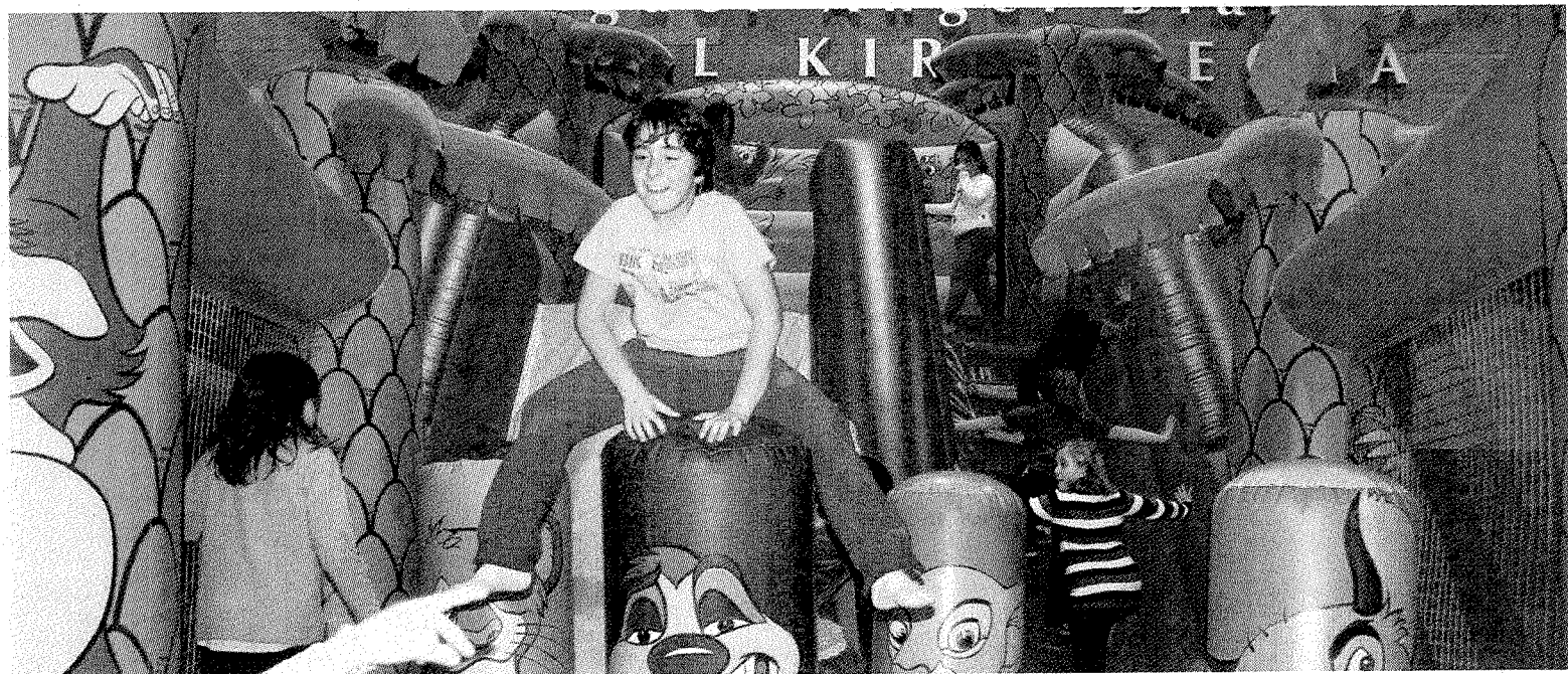
Los hinchables siguen siendo, año tras año, una de las principales atracciones del parque de Navidad de Ermua.