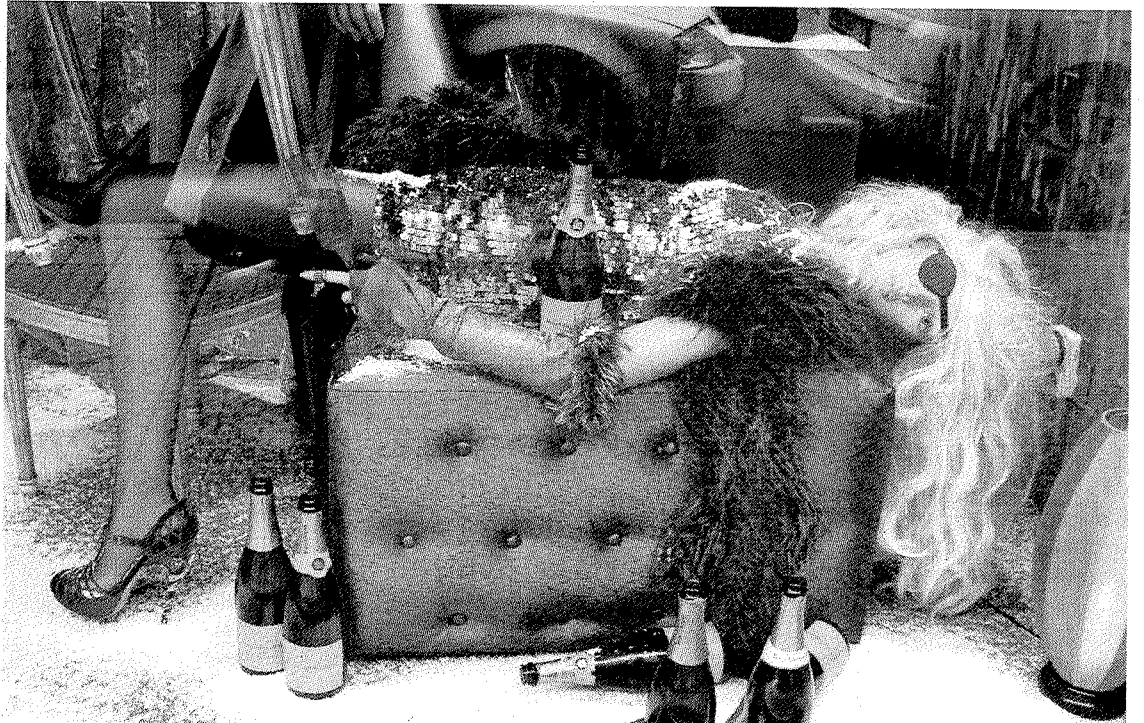
El champán y las lentejuelas crean un ambiente de 'glamour' en la propuesta de Nolita. ■ E.C.

Las obras obligarán a construir un nuevo enlace de Ermua en la A-8 con área de cobro, incluyendo la ampliación a tres carriles y la mejora del trazado de la autopista en este tramo. Esta es la primera de las siete nuevas carreteras radiales que sale a licitación. Le seguirán los viales de Urberuaga-Berriatua, Gerediaga-Elorrio, Boroa-Igorre, Amorebieta-Muxika, Mungia-Bermeo y la variante de este último municipio.