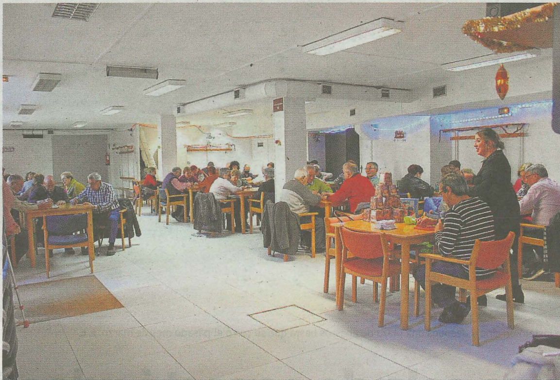
El Hogar de las personas jubiladas de Pasialeku también obtiene una subvención para sus actividades. A. L.

Se ha previsto, además, ayudas a familias en riesgo de quie-