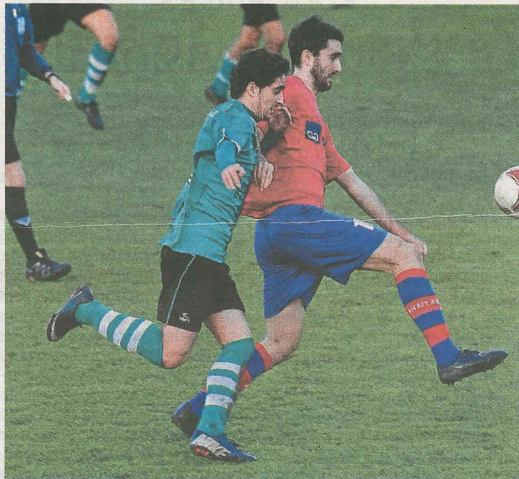
El Anaitasuna será el próximo rival del Aurrera. :: SUDUPE