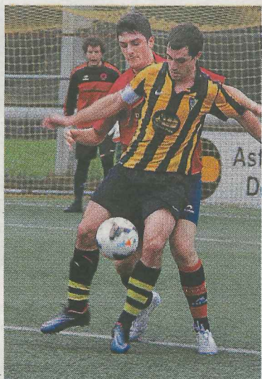
Partido del Preferente. :: SALEGI

El juvenil se llevó una excelente victoria en Mintxeta en un encuentro muy serio. Estuvieron bien asentado en el campo, supieron jugar y marcaron los tiempos del choque. Pronto se vio que se iba a tratar de un encuentro disputado y de mucho físico. Los debarras fueron incrementando el ritmo y acabaron dominando ante un Elgoibar preocupado en defender. Saraiva e Imanol pusieron al Amaikak con ventaja, para pasar luego a controlar el esférico y demostrar su superioridad. Los locales maquillaron el resultado en la última jugada, pero sin poner en peligro los tres puntos para el bando visitante.