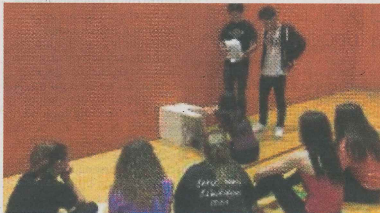
Actividades realizadas en la ikastola Anaitasuna. :: EL CORREO

informa igualmente de los beneficios físicos, sociales y emocionales que ofrece una vida activa.