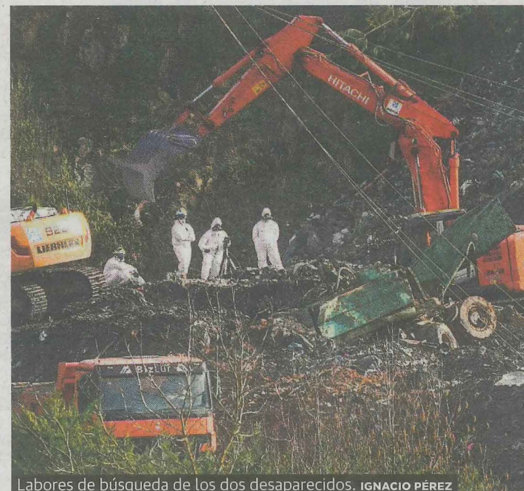
Labores de búsqueda de los dos desaparecidos.

Hace solo veintiséis días que el vertedero de Zaldibar se vino abajo sepultando a dos trabajadores y desencadenando una crisis ambiental sin precedentes en el País Vasco. Hace solo dieciocho días que la presencia en el aire de sustancias tóxicas derivadas de la combustión de los residuos puso en alerta a los municipios del entorno del vertedero y llenó nuestra actualidad de miedo y mascarillas. Hace solo catorce días que el lehendakari Urkullu reconocía en una comisión parlamentaria que los controles sobre el vertedero no fueron los suficientes. Dos semanas después, da la sensación de que el desastre de Zaldibar sucedió hace mucho tiempo. El suceso ha terminado en el vertedero de la actualidad, empujado por una epidemia vírica global. Las mascarillas son ahora todas para el coronavirus y solo el