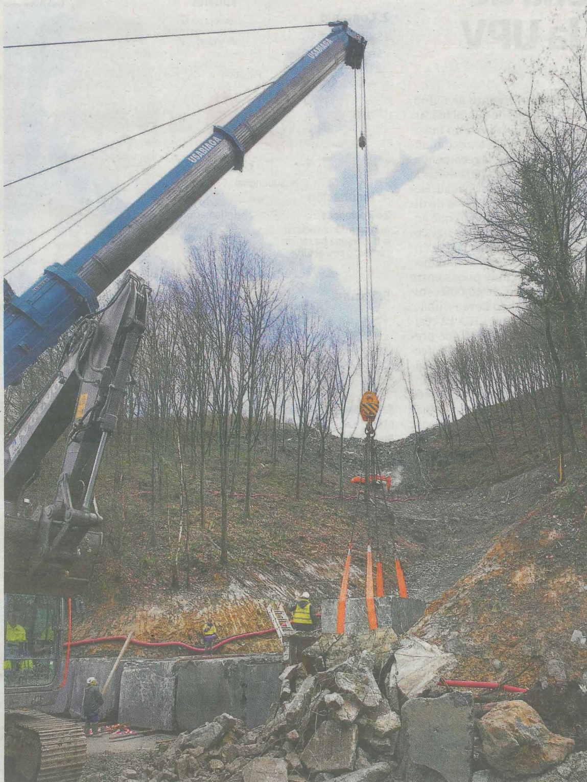
Labores de construcción de la escollera con una maquinaria especial que alza rocas de 45 toneladas.

Según explicaron ayer desde la administración foral, la construc-