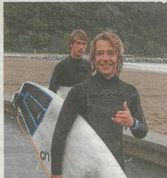
Bitor, en su pase a cuartos.