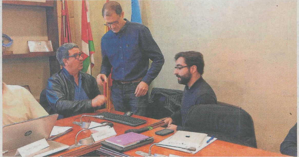
Los representantes de la firma, a la derecha, antes de la presentación de su proyecto piloto.

servicio de armarios instalados en diferentes puntos es que se reduzca el impacto del transporte de mensajería en las ciudades en las que actúa. De hecho, se ha conseguido que en los lugares en los que se ha implantado se reduzcan en un 20% los envíos fallidos, es decir, los que no llegan en un primer viaje a los clientes de los 'couriers' o empresas de transporte de mensajería y paquetería.