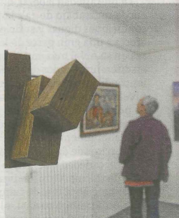
Muestra en el Palacio Aguirre por el derecho a decidir.

Una treintena de artistas locales desde amateurs hasta profesionales han colaborado en esta exposición. Lapari hizo un llamamiento a artistas locales y todos aceptaron gratamente a colaborar, por falta de espacio no pudieron extender a más personas la invitación. La persona que asista a esta exposición podrá ver desde cuadros (fotografías, pinturas y serigrafías) y esculturas hasta un collage con poemas que rememoran el bombardeo sufrido la localidad vizcaína de Gernika. 22 cuadros, 7 esculturas de madera y de piedra y un collage forman esta muestra que permanecerá abierta hasta el 7 de mayo. Los días laborables (de lunes