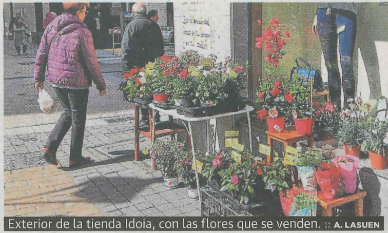
Exterior de la tienda Idoia, con las flores que se venden. ■ A. LASUEN

marcha una iniciativa de venta de flores, a un precio simbólico, para colaborar con la iniciativa 'Ongi etorri errefuxiatuak'. Las flores, con la pequeña bandera amarilla que representa la solidaridad con la población refugiada estarán a la venta en este establecimiento hasta la celebración de la Fiesta Intercultural del próximo sábado en la plaza Cardinal Orbe. Entonces se podrá disfrutar allí de un paisaje simbólico en el que las flores y los corazones derribarán muros.