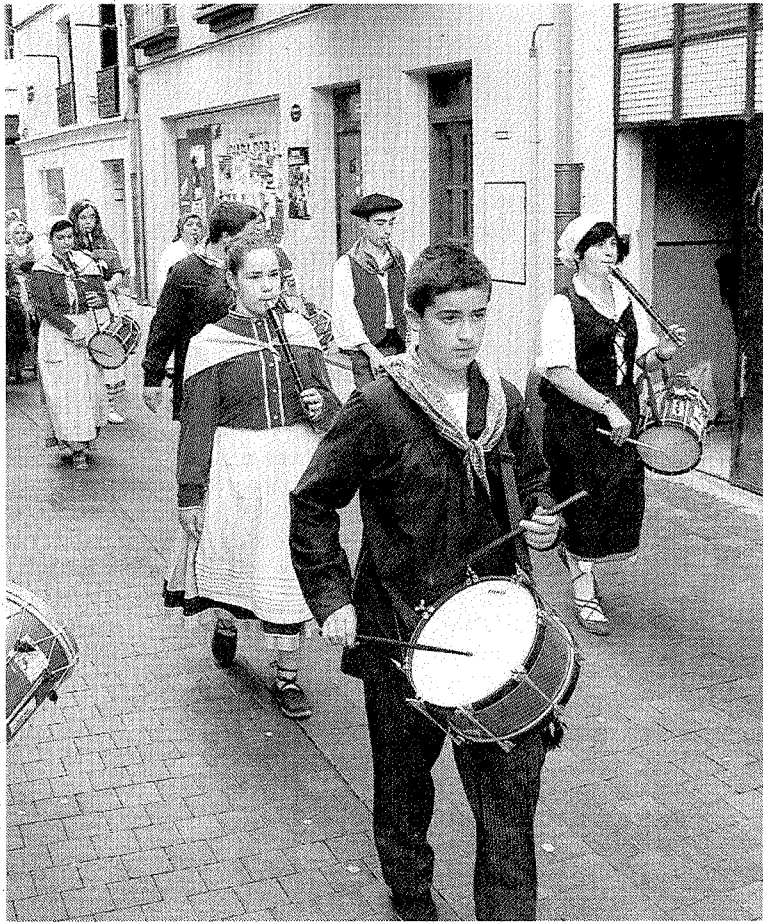
Los txistularis recorren las calles en la pasada Euskal Jaia.

El arte se respirará por las calles el 13 de septiembre. La asociación Haitz Haundi volverá a organizar una nueva edición de su ya tradicional Concurso de Pintura al Aire Libre. Los participantes cogerán sus pinceles y sus lienzos y buscarán un buen lugar para elaborar su obra. El certamen se desarrollará por la mañana y repartirá premios para los