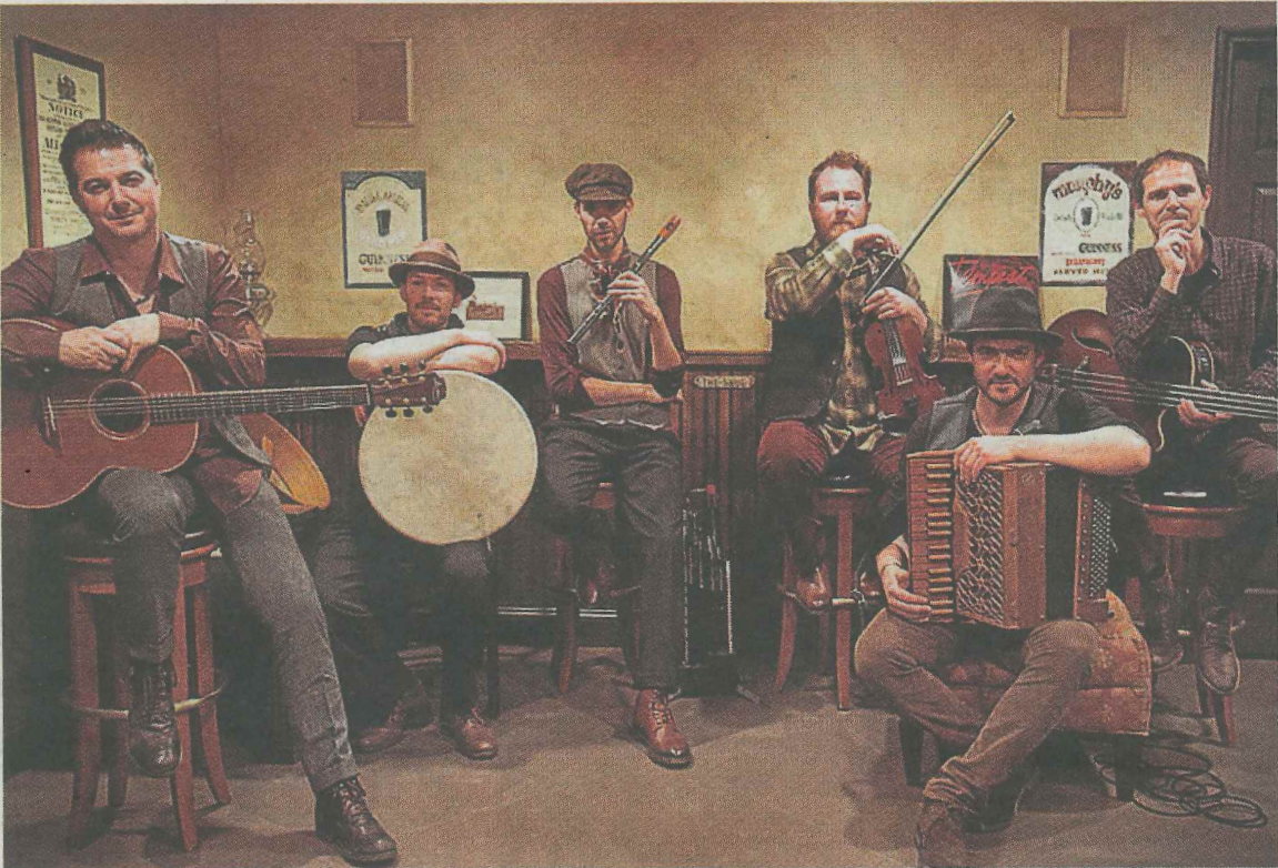
Los franceses de Doolin acaban de grabar su último disco en Nashville. EL CORREO

Fetén Fetén ofrece una lectura contemporánea, pero distinta, de la