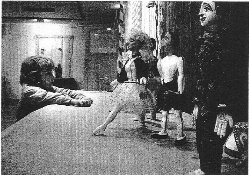
DESOLUMBRANTE. La muestra atrae de forma irresistible a los niños.

Esta exposición se puede visitar los días laborables de 18 a 20 horas y los sábados y domingos de 12 a 14 horas y de 18 a 20 horas.