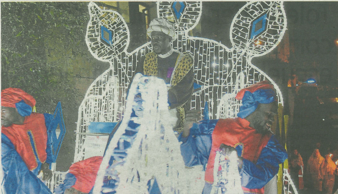
Los Reyes Magos saldrán del colegio San Lorenzo a las 18.00 horas para recorrer el centro del municipio. A. L.