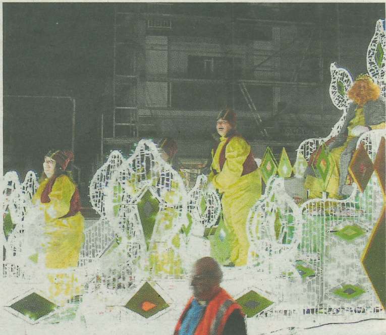
Sus Majestades lanzarán una tonelada de caramelos. A. L.