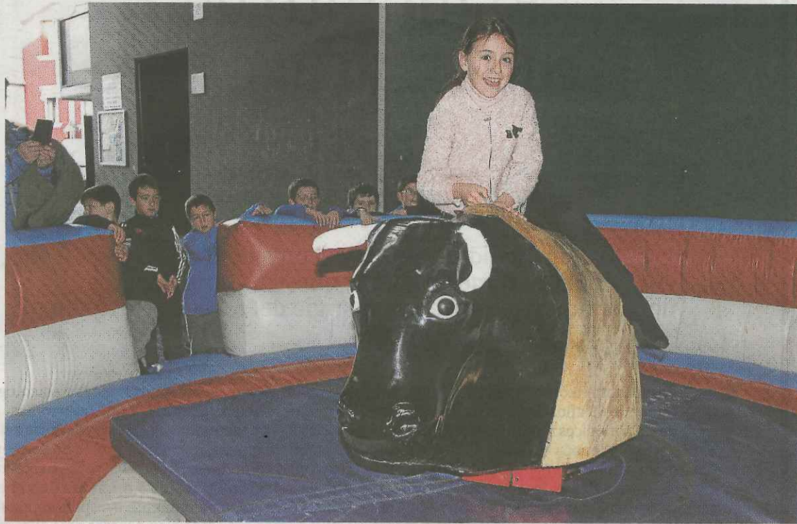
Dominando al toro mecánico con una gran sonrisa.