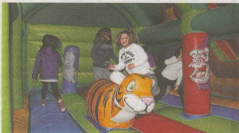
Los debarras más pequeños podrán disfrutar hoy también del PIN.