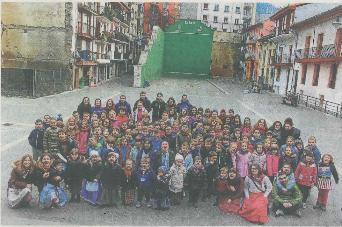
Grupo de niños y niñas que han participado en las colonias infantiles de este año.