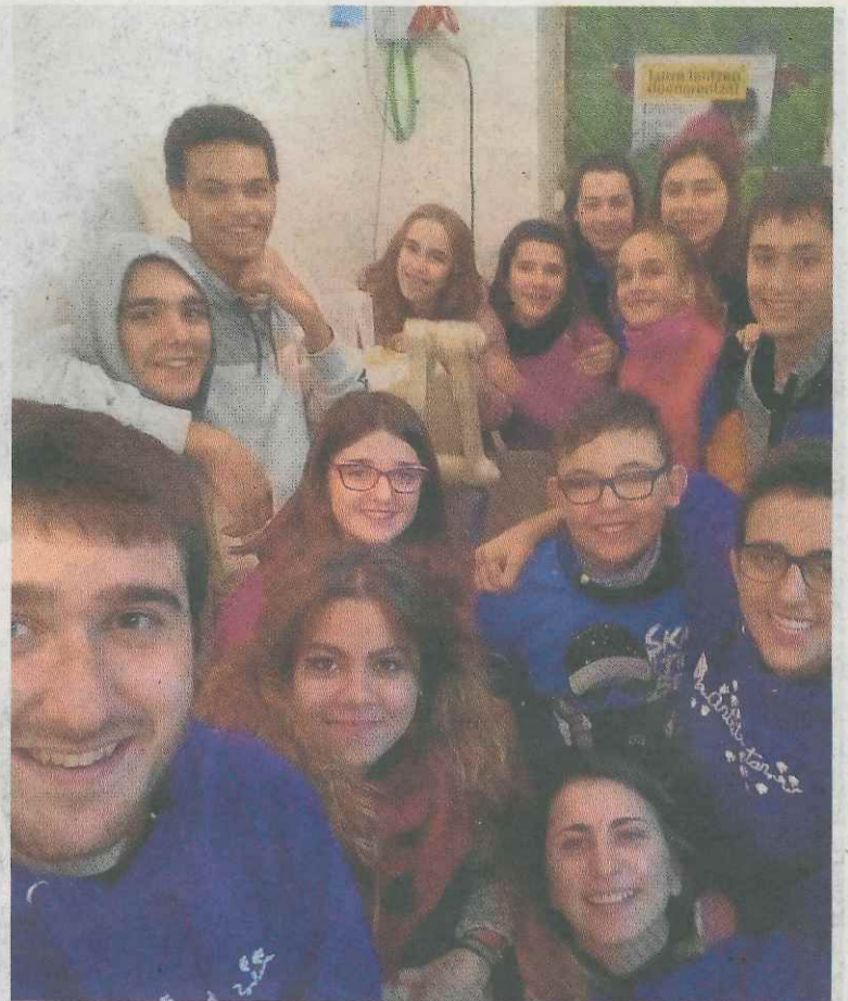
Los jóvenes de 12 a 16 años también han tenido su espacio.