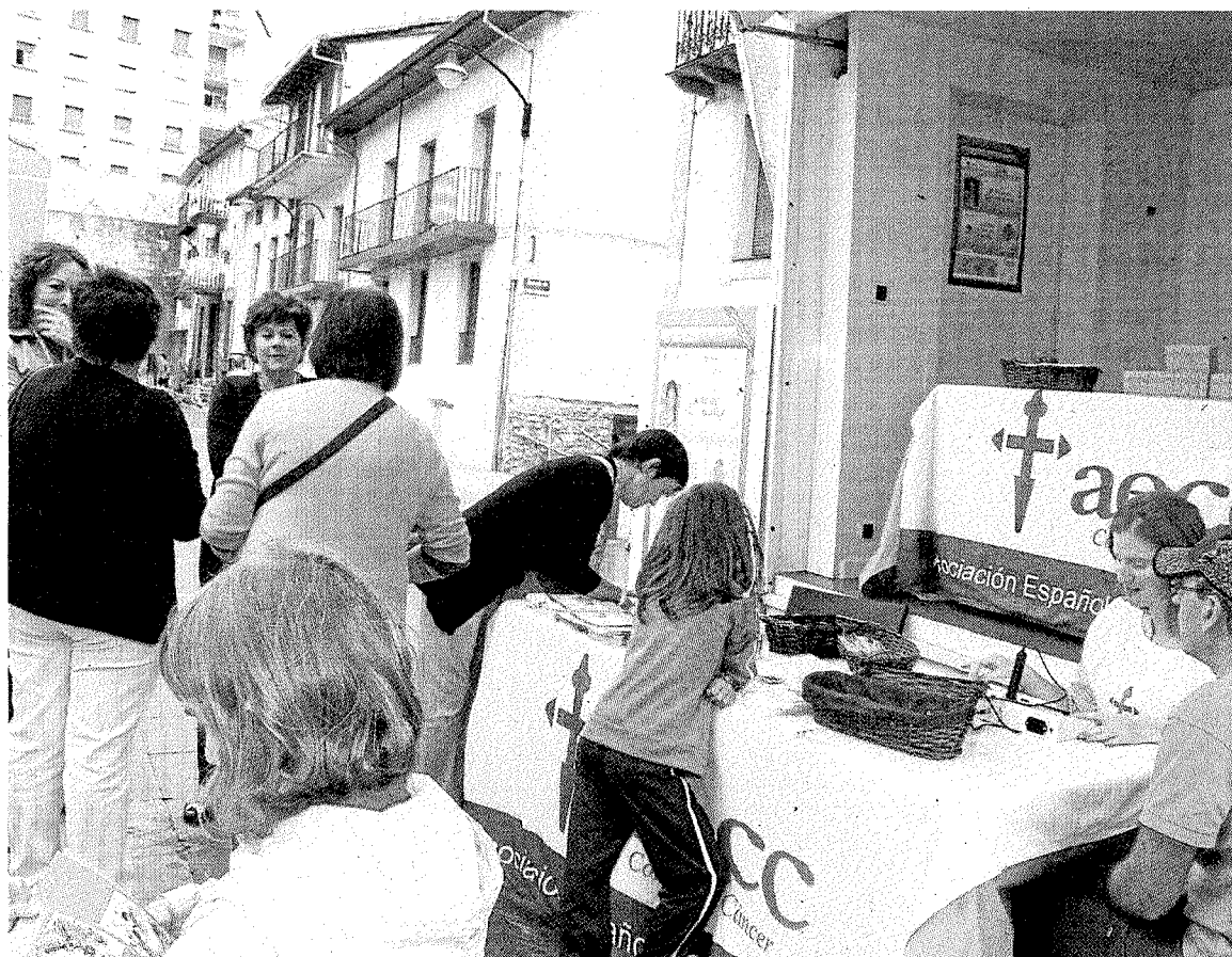
Voluntarias y responsables médicos en una campaña anterior sobre el cáncer de piel en Ermua.

En este foro se encontrarán profesionales de la Medicina, pacientes afectados por diferentes cánceres y familiares de pacientes que hablarán sobre si se recibe la atención necesaria cuando se diagnostica cáncer por primera vez. También se debatirá sobre la calidad de esta atención y sobre el tratamiento quirúrgico, oncológico y la atención psicológica.