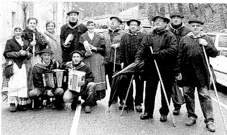
Herriko koadrilak makila eskuetan dutela atera ziren abestera.

Continuando con el criterio aplicado en la presente legislatura, hoy a partir de las 7 de la tarde se procederá en la casa de cultura Zabel, a la presentación pública del documento de presupuestos y actuaciones más importantes que prevé realizar el Gobierno municipal el presente año.