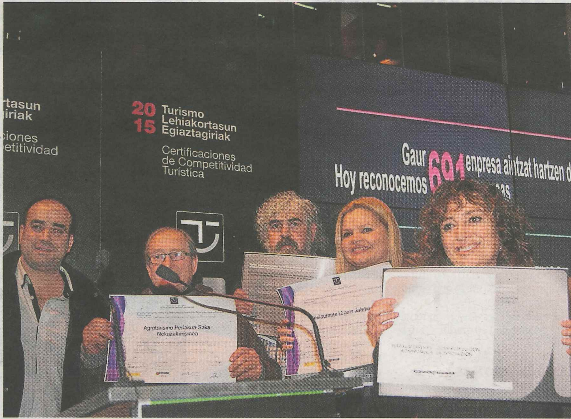
La responsable del hostel Mérida, a la derecha, en el acto de recepción del distintivo.

Además, este mismo establecimiento hotelero obtuvo el año pasado la acreditación de competitividad turística del Gobierno vasco.