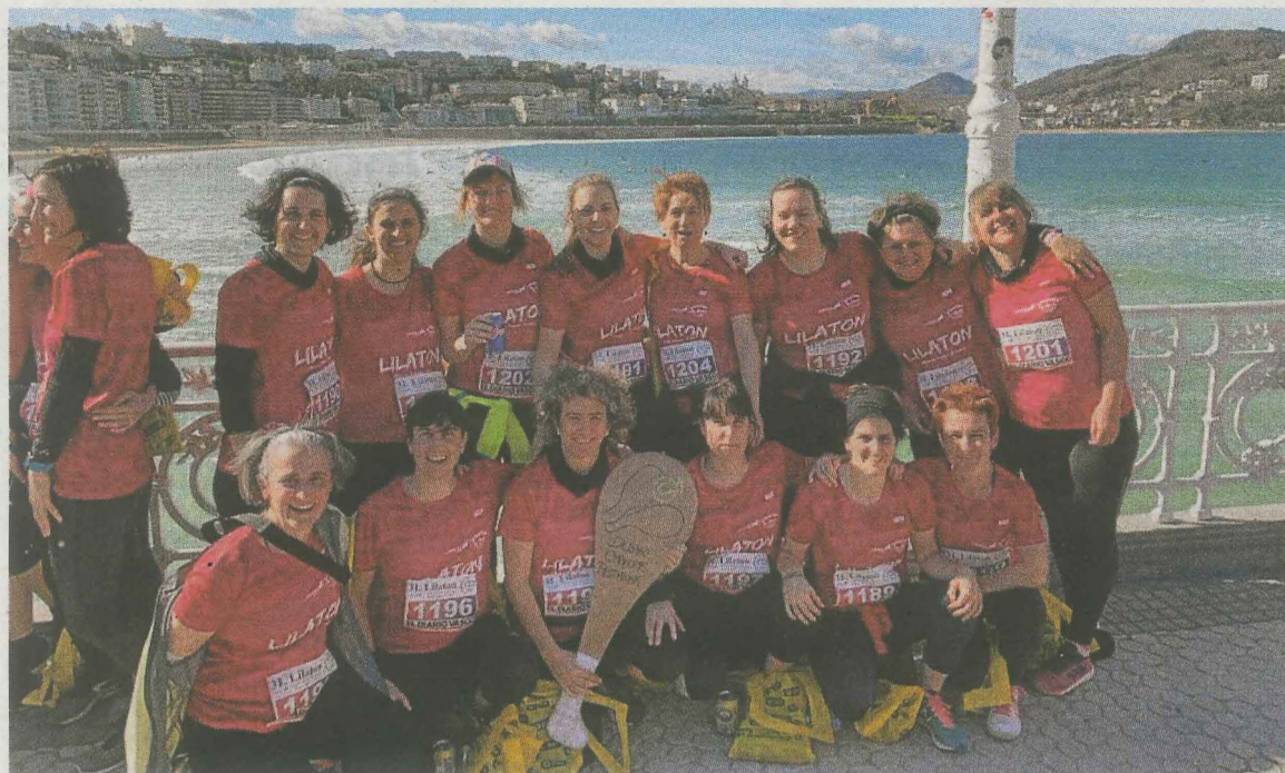
Iruleak Emakume Pilotariak en el Lilatón de Donostia. SALEGI