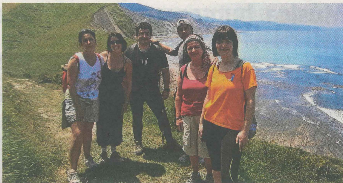
Una de las caminatas a Zumaia de anteriores ediciones. A. L.