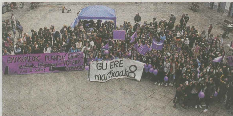
Las concentraciones del 8M cada año son más numerosas. SALEGI

El domingo 8 de marzo, se celebrará el Día Internacional de las Mujeres, por esa razón la localidad acogerá numerosas actividades. A lo largo de la mañana, Debako Talde Feminista ha organizado diferentes talleres di-