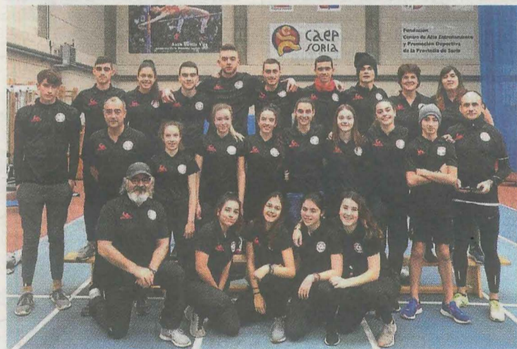
El grupo de atletismo de Ermua. A. L.

La gran actuación de los atletas del grupo ermuarra no solo se limitó a la consecución de ese pasaporte para el campeonato estatal, sino que estuvo refrendada por las buenas marcas conseguidas, por las clasificaciones obtenidas y por el número de medallas.