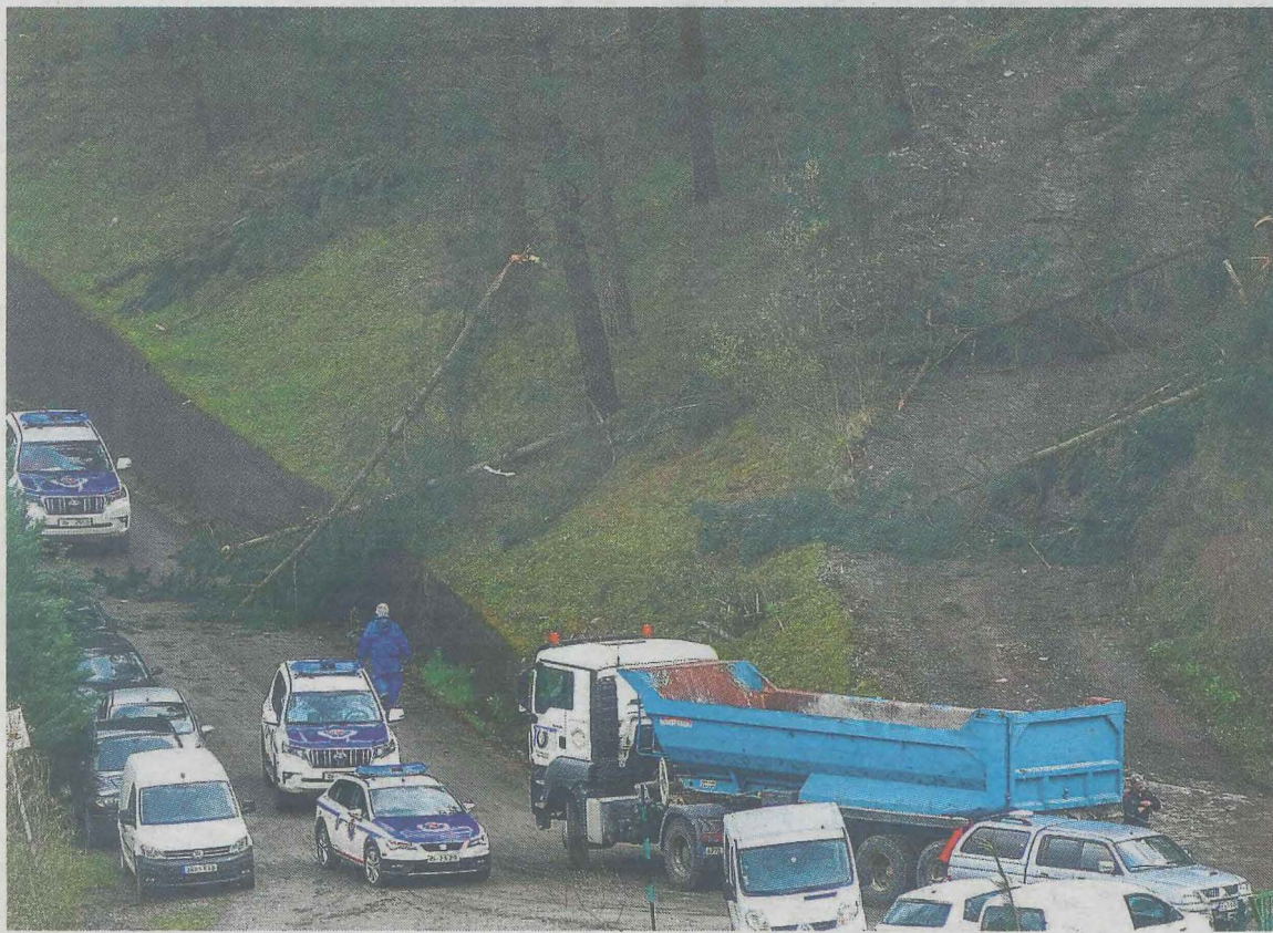
El fuerte viento derribó ayer varios árboles sobre los accesos al vertedero de Zaldibar.